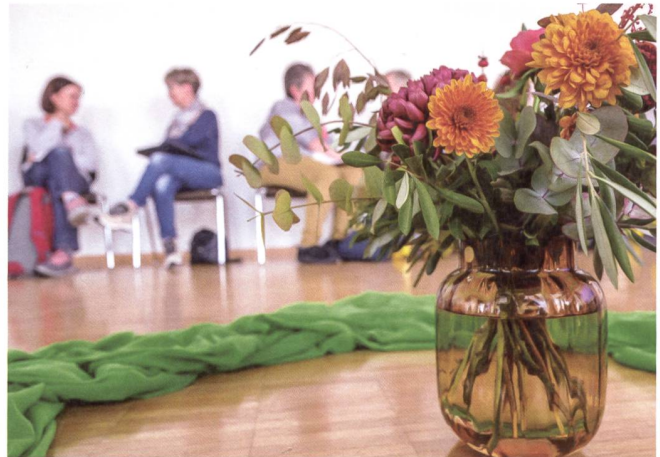
Vertiefung in den Workshops