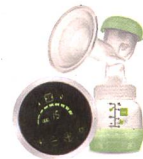
2in1 Einzelmilchpumpe / Tire-lait 2en1 individuel