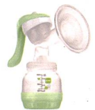
Handmilchpumpe / Tire-lait manuel

96%* Weiterempfehlungs- rate bei Schweizer Mamis