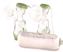
2in1 Doppelmilchpumpe / Tire-lait 2en1 double