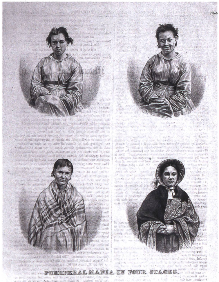
La folie puerpérale en quatre stades («Puerperal mania in four stages»). Medical Times Gazette, 1858

internées, les mères présentent des formes de folie spécifiques. Au delà d'une série de controverses autour de l'étiologie et de la symptomologie, le diagnostic se stabilise au cours du 19 e siècle et il devient courant. Dans un dictionnaire de médecine, publié en 1872, on peut ainsi lire à l'entrée «folie puerpérale»: «Cette espèce comprend toutes les formes d'aliénation qui se développent chez la femme, à l'occasion des différentes phases des fonctions génératrices, la gestation, la