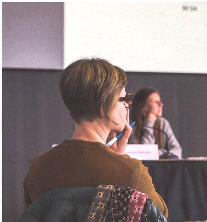
Le Groupe Pivot en atelier: réflexion et échanges interprofessionnels sur la pratique (voir aussi p. 52)