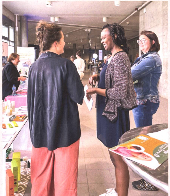
Discussions lors d'une pause au sein de l'exposition