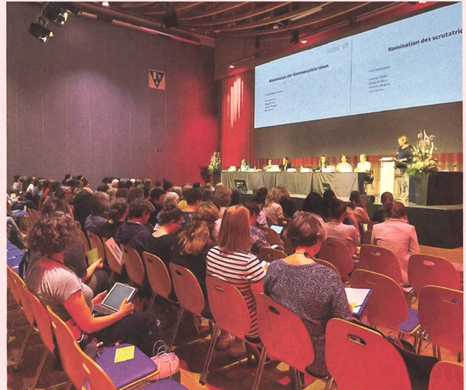
L'assemblée des délégué·e·s a rassemblé cette année 90 délégué·e·s

Voir la prise de position conjointe avec Physio Swiss (en allemand) sur www.sage-femme.ch