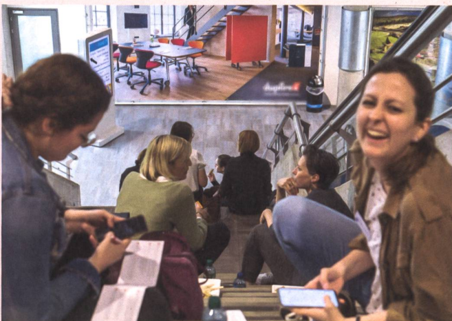
Pause détente dans l'entrée du Forum