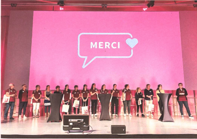
Remerciements au staff, élément essentiel du bon déroulement du congrès