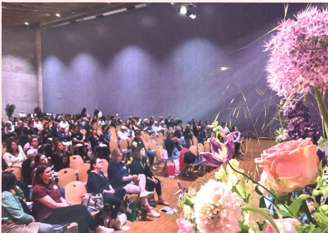
Dans la salle du congrès - en attendant la reprise des interventions