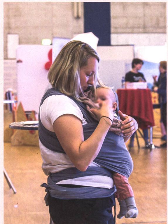
Le Congrès suisse des sages-femmes, un événement tous publics