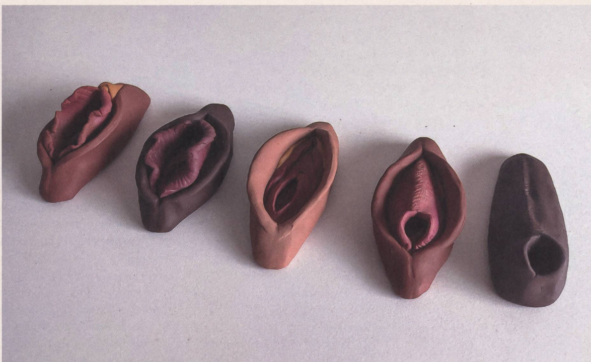
Set de vulves en pâte fimo représentant les différents types de MGF/E. Fabrication: Leah Brickhouse, https://solsisters.se