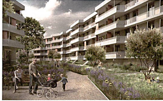
◀ 3 Die städtische Siedlung Stöckacker Süd: Abriss der 1945-1946 erstellten Mehrfamilienhäuser im Sommer 2013 ...