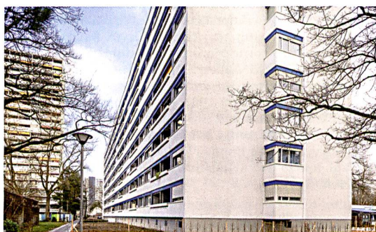
◀ 9 2016 wurde dem Scheibenhause an der Waldmannstrasse 25 über die gesamte Gebäudelänge eine drei Meter tiefe Raumschicht hinzugefügt. Die bauzeitliche Volumetrie – jene des Baus und jene der ganzen Siedlung – wurde dadurch verunklärt.