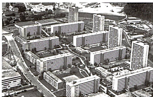
◀ 8 Das Tscharnergut mit seinen schlanken Scheibenhäusern kurz nach dem Bau. Die einzelnen Gebäudevolumen sind sorgfältig aufeinander und auf die Freiflächen der Siedlung abgestimmt.

beteiligten Partnern gemeinsam die Potenziale der Weiterentwicklung solcher Bauwerke entdeckt werden – ohne sie voreilig aus wirtschaftlichen Interessen abzureissen, damit unwiederbringlich historische Bausubstanz zu zerstören und der sozialen Verdrängung weiter Vorschub zu leisten. Bei Bauten von solch grossem «kulturellem, historischem und ästhetischem Wert» 19 , d. h. gemäss Gesetz: bei Denkmälern – und zu diesen zählt übrigens nur