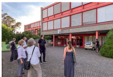
▲ 3 Von aussen präsentiert sich das Schulhaus in seiner ursprünglichen Gestalt.

gion einzusetzen und mit seinem Know-how denkmalgerechte Sanierungen von erhaltenswerten Objekten zu fördern. Bei dieser Arbeit sind Interessenskonflikte manchmal nicht zu vermeiden. Die Stadtführungen 2021 zeigten jedoch, wie mit gegenseitigem Verständnis, mit grosser und interdisziplinärer Fachkompetenz substanzschonende und gleichzeitig zukunftsweisende Lösungen gefunden werden können. Aufgrund der