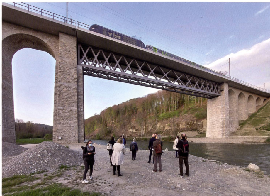
▲ 1 Beim Saaneviadukt in Gümmenen erhielten die Besucherinnen und Besucher spannende Einblicke in die Geschichte des Bauwerks und die ingenieurtechnisch anspruchsvollen Sanierungsarbeiten.

des Heimatschutzes, Matthias Zuckschwerdt, und die Inventarisatorin des Inventars der schützenswerten Ortsbilder der Schweiz (ISOS), Giuliana Merlo, dem komplexen Thema Ortsbildschutz annahmen. Den interessierten Teilnehmerinnen und Teilnehmern wurde erläutert, aufgrund welcher Qualitäten ein Ortsbild ins ISOS aufgenommen wird. Die beiden Referierenden zeigten auch auf, worauf bei Um- und Neubauten innerhalb eines schützenswerten Ortsbilds zu achten ist, wie ortsbauliche Strukturen erhalten und eine «Ausfransung» des Ortsrands verhindert werden kann.