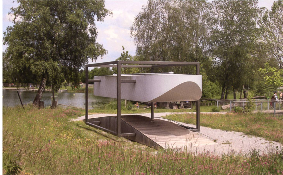
▲ 17 Die Vitrine mit dem 2011 geborgenen Einbaum beim Strandbad Moossee.

kräftig profilierten Stützen auf mächtigen Blockkonsolen. An der Laubenbrüstung des Dachgeschosses sind bauzeitliche Brüstungsbretter mit feinen Ausschnitten erhalten. Wer gut zu Fuss ist, nimmt jetzt den Weg ins Naherholungsgebiet unter die Füsse und geht entlang der Bubenloostrasse zum Waldlehrpfad und zum Aussichtspunkt im Bubenloowald ©. Die Burgergemeinde Urtenen hat