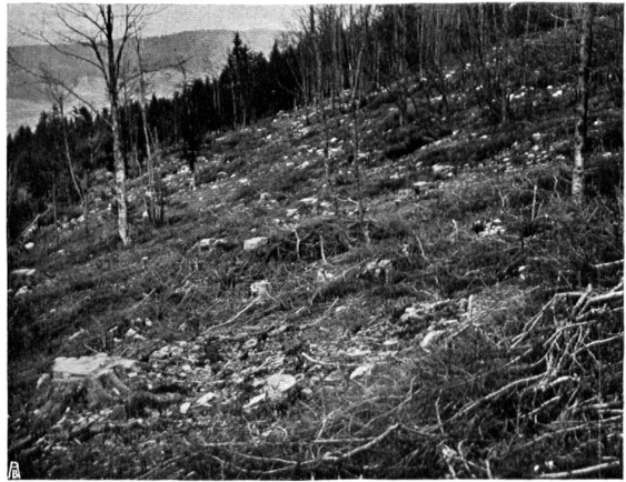
RAUBWIRTSCHAFT IM WALDE. Kahlschlag aller kommerziell ein- träglichen Bäume mit unordentlicher Hinterlassung des Strauch- und Astholzes, das die keimenden Sämlinge erstickt * COUPE RASE, exploitation ruineuse des assortiments de gros rapport avec abandon désordonné des menus bois et des épaves qui, en couvrant le sol, étouffent et empêchent le réensemencement **

** Coups rases prohibées par la loi forestière de 1897