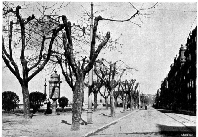
UNNATÜRLICH BESCHNITTENE PLATANEN am Quai des Eaux-Vives zu Genf PLATANES TRONQUÉS. Quai des Eaux-Vives à Genève

De la brochure «Les Plantes et l'Esthétique des villes» par Guillaume Fatio, Genève.