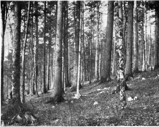
GESCHONTER UND GEHEGTER HOCHWALD durch sorgfältige Nutzung allmählich verjüngt FORÊT AMÉNAGÉE ET TRAITÉE d'après de bons principes de sylviculture

* Die Raubwirtschaft verbietet das Forstgesetz von 1897