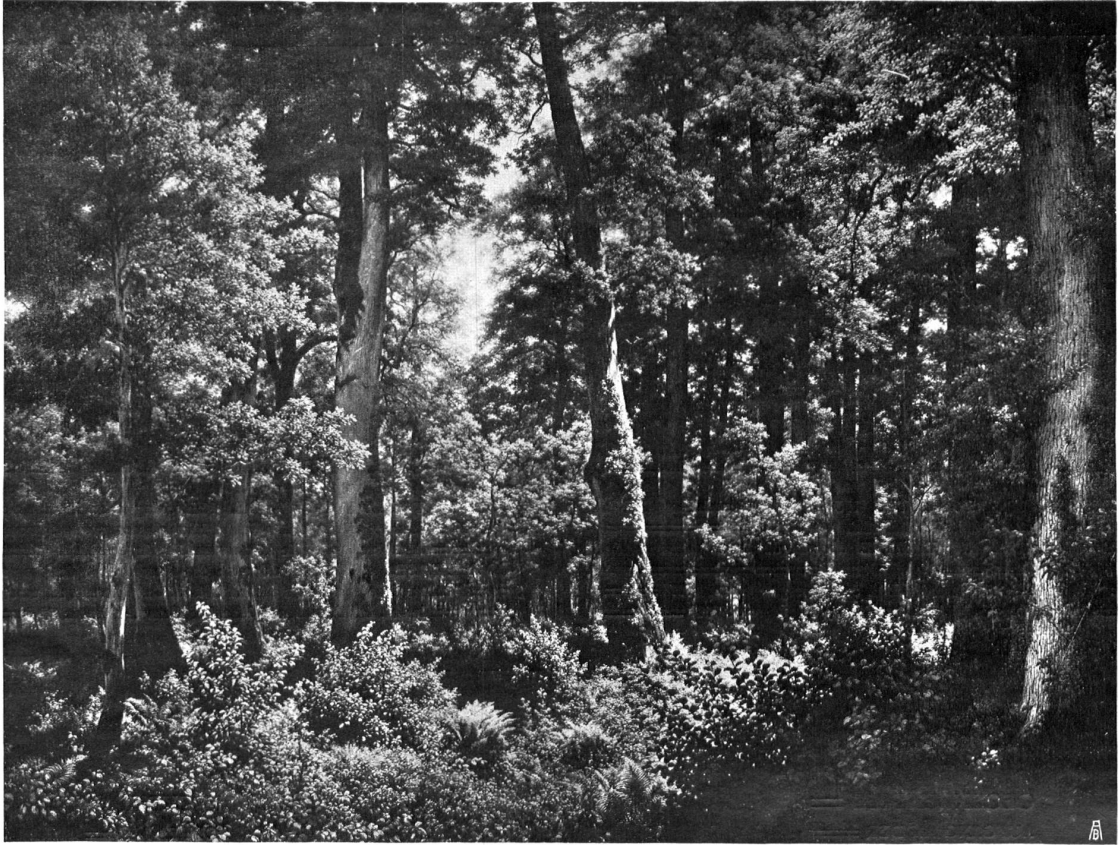
===== EICHENWALD. Von Robert Zünd in Luzern ===== FORET DE CHÊNES. De Robert Zund à Lucerne ===== ===== Aus der Sammlung des Künstlerguts zu Zürich =====

In freiem Stande aufgewachsene, vor menschlichen Eingriffen bewahrte Buchen