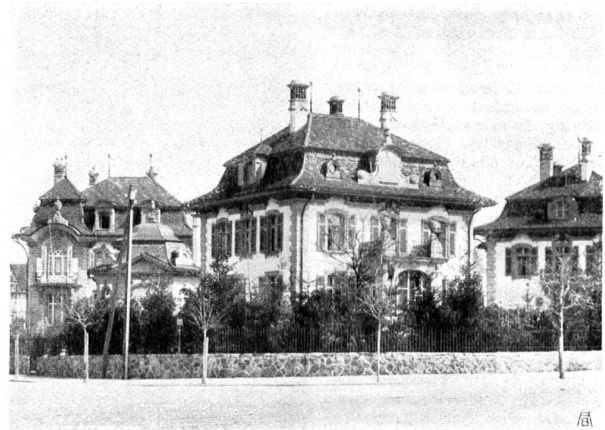
===== VILLEN AUF DEM KIRCHENFELD IN BERN – VON ARCHITEKT VON FISCHER IN BERN – Photographien von H. Völlger in Bern ===== ===== VILLAS AU KIRCHENFELD A BERNE – ARCHITECTE VON FISCHER A BERNE =====

(S. 29). Andere Brunnen haben ihre gemütlichen, breiten Becken gegen schmale Tröglein vertauschen müssen; gute alte Häuser wurden durch banale oder solche neue ersetzt, von denen Goethe unmöglich sagen könnte, es sei keine leere Dekoration an ihnen.