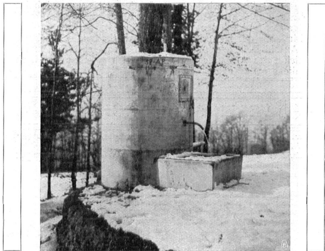
HÄSSLICHER MODERNER WALDBRUNNEN BEI ZÜRICH MAUVAIS EXEMPLE D'UNE FONTAINE DANS LA FORÊT

Die Schiffbarmachung der Oberengadiner Seen. Die Gemeindeversammlung von St. Moritz hat das Konzessionsgesuch für die Schiffbarmachung der Oberengadiner Seen mit grosser Mehrheit abgelehnt. Die Gemeinde Silvaplana hatte schon früher