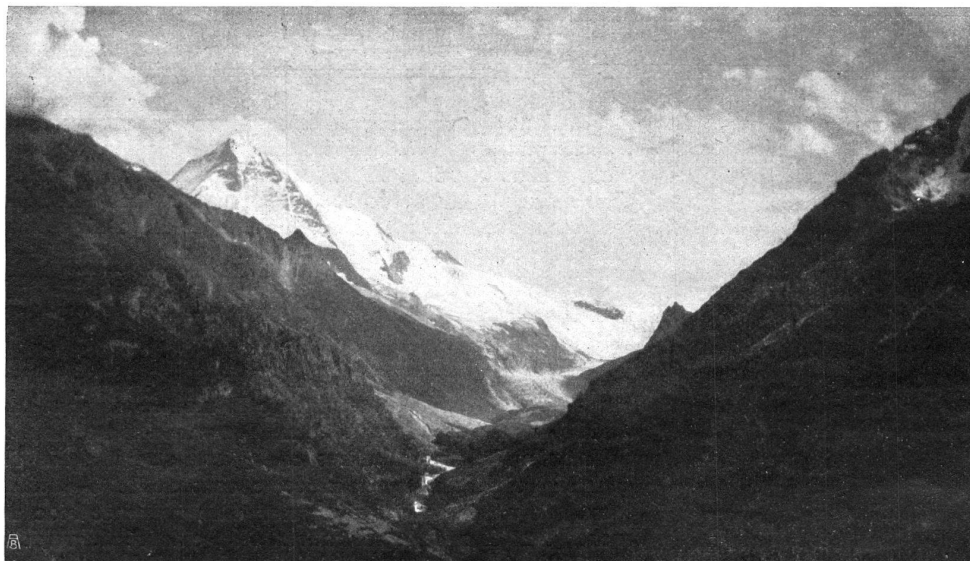
Fig. 3. Le glacier de Ferpècle et l'Alpe de Bricolla. Abb. 3. Blick auf den Gletscher Ferpècle und Alpe de Bricolla.

Mais avant de se reposer dans d'excellents hôtels, — car il n'y a pas seulement des chalets à Arolla, — reportons un peu nos yeux sur ces belles forêts d'arolles (fig. 13 et 14, p. 46 et 47), et admirons la belle nature. —