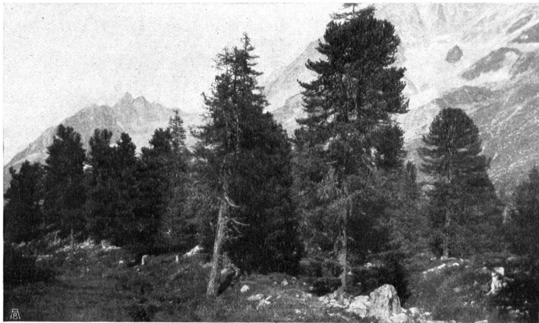
Fig. 14. Quelques beaux spécimens d'arolles.

Möchte der Wunsch des Herausgebers, seinen alten Erbbesitz seines Volkes nicht nur erhalten, sondern auch neu belebt zu haben, in Erfüllung gehen. O. v. Greyerz.