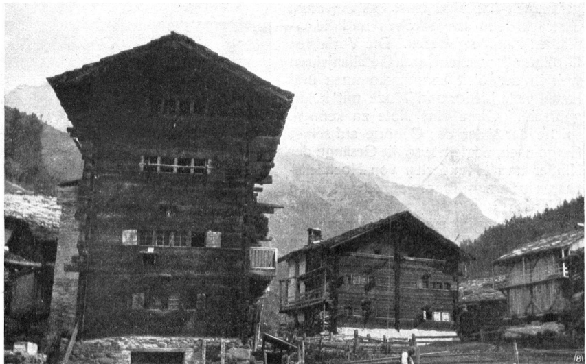
Fig. 2. Vieilles maisons de bois aux Haudères. — Abb. 2. Alte Holzhäuser in Les Haudères.

Montons encore pour admirer le beau panorama qui se déroule devant nous. C'est d'abord l'immense Pigne d'Arolla avec son épaisse couche de neige au sommet