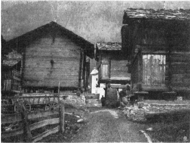
Fig. 1. Une rue aux Haudères. Abb. 1. Strassenbild aus Les Haudères.

LA REPRODUCTION DES ARTICLES ET COMMUNIQUÉS AVEC INDICATION DE LA PROVENANCE EST DÉSIRÉE