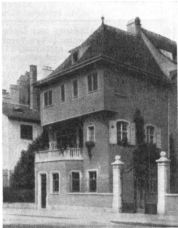
Abb. 20. Durch einen kastenartigen Vorbau mit Kalksteinterrasse erhält der Bau ein Äusseres voll harter Linien von schlechten Proportionen. Auch das Holzgitter wurde dem Umbau geopfert. — Fig. 20. Grâce à la nouvelle construction carrée et lourde, surmontée d'une terrasse, qui a été ajoutée à l'ancien bâtiment, celui-ci a perdu ses agréables proportions, et la pittoresque balustrade en bois a disparu en même temps.