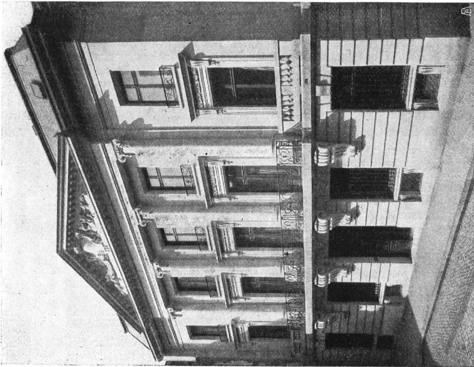
Abb. 18. Bankhaus an der Freien Strasse in Basel. Gediegener Bau vor der Umgestaltung in ein Warenhaus. — Fig. 18. Hôtel de banque distingué dans la Rue Franche à Bâle. L'édifice avant sa transformation en Grands Magasins.