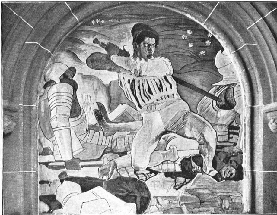
Abb. 5. Kämpfender Schweizer Krieger in der Schlacht bei Marignano. Eines der Wandbilder Ferdinand Hodlers in der Waffenhalle des Landesmuseums in Zürich. — Fig. 5. Suisses combattant à Marignan. Une des fresques de F. Hodler dans la salle des armes au Musée national de Zurich.

ausholende Soldaten; die grossen Linien, die energisch sich kreuzenden Richtungen, die nämliche Potenz der Bewegung auf einige Träger der Handlung verteilt, und dahinter errät der Beschauer das Gewoge des Kampfes in Schwertern und Lanzen. Das kann nur schildern, wem einmal ein Kampf zum Erlebnis geworden ist.