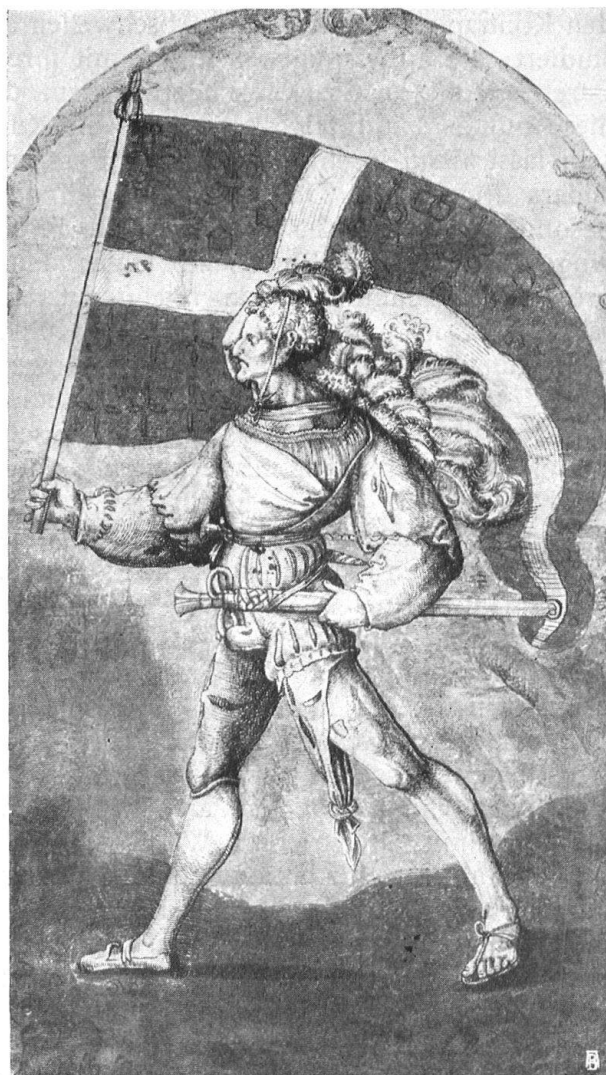
Abb. 2. Der Bannerträger von Solothurn. Nach der Zeichnung von Urs Graf. Im Besitz der Öffentlichen Kunstsammlung, Basel. — Fig. 2. Le porte-bannière de Soleure, d'après le dessin de Urs Graf. Propriété du Musée des beaux-arts de Bâle.

Aber nicht nur als dekorative Zutat wurden die prächtigen Recken verwertet; andere Meister fanden an ihnen noch mehr künstlerisch Interessantes. Da zeigt das sogen. Skizzenbuch des Berners Niklaus Manuel (Basel, Öffentliche Kunstsammlung), wie der Zeichner an lauter Einzelfiguren in verschiedenen Stellungen