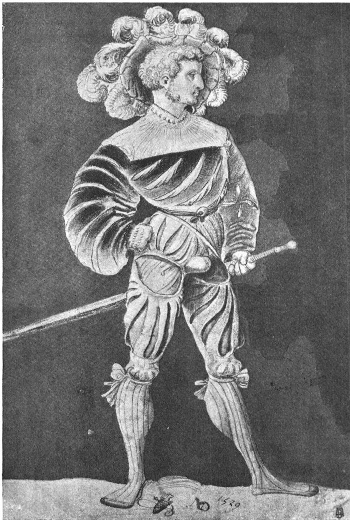
Abb. 1. Schweizer Landsknecht. Nach der Zeichnung von Niklaus Manuel (datiert 1529). Im Besitz des Kunstvereins Basel. — Fig. 1. Lansquenet suisse, d'après le dessin de Niklaus Manuel (daté de 1529). Propriété du Kunstverein de Bâle.

Wenn die Tagesereignisse und das Tagesinteresse im Zeichen des Mars stehen, wenn die Hoffnungen aller nicht Bewehrten sich auf die Armee richten und so unwillkürlich die Gedanken und Erwartungen an die Kriegstaten der alten Eidgenossen anknüpfen, so bringt gewiss die vorliegende Nummer des « Heimatschutz » nichts Unzeitgemässes, wenn sie daran erinnert, wie Kriege und Krieger unserer grossen Vergangenheit durch Künstlerhand unsterblich geworden sind und uns täglich in unverminderter Kraft vor Augen treten, mehr noch als in langen Chronikberichten. Es handelt sich nicht um die Aufzählung von