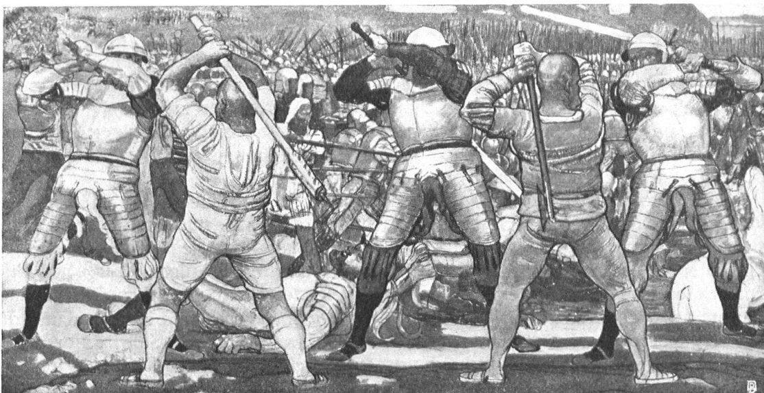
Abb. 4. Episode aus der Schlacht von Näfels. Nach dem Gemälde von Ferdinand Hodler (1897). Im Besitz der Öffentlichen Kunstsammlung, Basel. — Fig. 4. Episode de la bataille de Näfels, d'après le tableau de F. Hodler (1897). Propriété du Musée des beaux-arts de Bâle.