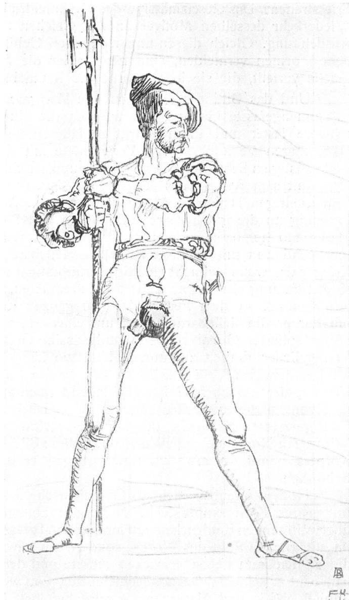
Abb. 6. Schweizer Landsknecht, den Rückzug von Marignano schirmend. Federzeichnung von F. Hodler zum Fresko im Landesmuseum. Im Besitz der Öffentlichen Kunstsammlung, Basel. — Fig. 6. Lansquenét suisse protégeant la retraite de Marignan. Dessin à la plume de F. Hodler, étude pour les fresques du Musée national, à Zurich. — Propriété du Musée des beaux-arts de Bâle.