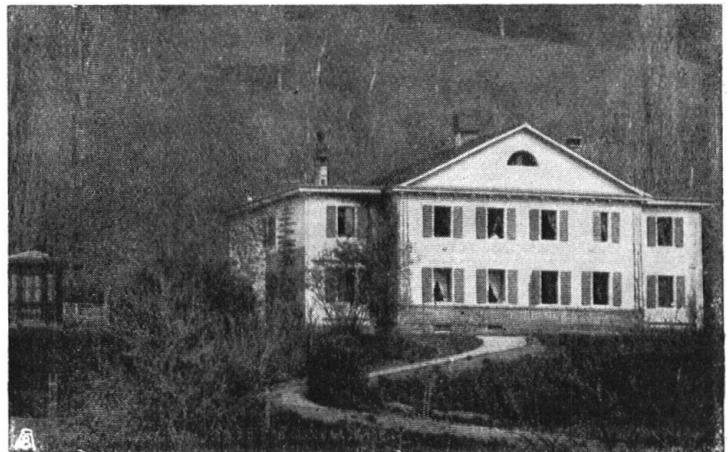
Abb. 15. Die „Blumenhalde“ Heinrich Zschokkes. In der Nachbarschaft der Garage. Die Landhäuser, wie sie Abb. 14 und 15 zeigen, bestimmen den Charakter der Strasse.