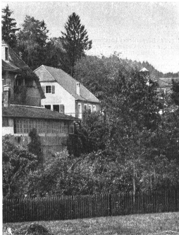
Abb. 13. Wie die Garage mit ihrer anspruchslosen, aber der Umgebung angemessenen, Silhouette sich der Nachbarschaft einfügt. Aufnahme von Hergert , Aarau. — Fig. 13. La silhouette du garage aux lignes sans prétention s'accorde parfaitement avec le paysage ambiant.