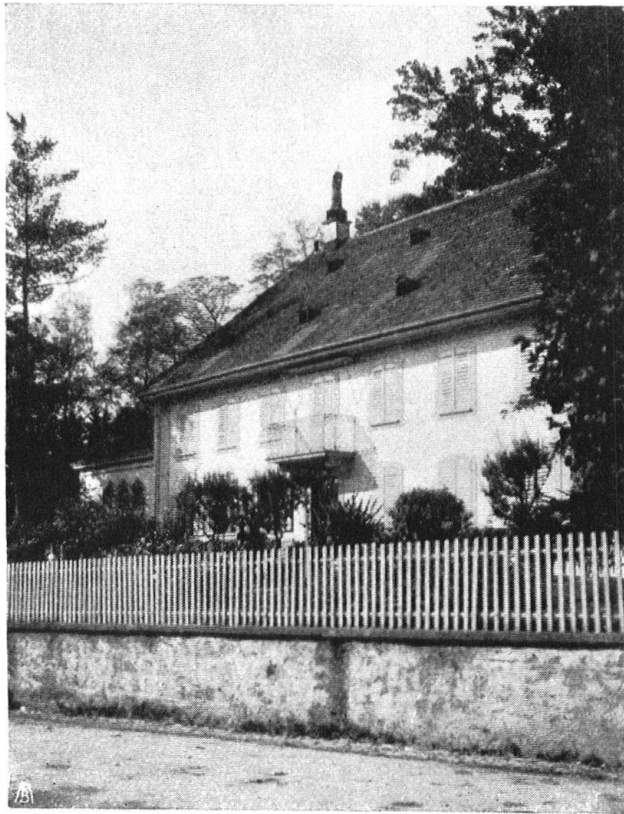
Abb. 14. Bürgerliches Landhaus in der Küttigenstrasse, gegenüber der neuen Garage. — Fig. 14. Maison de campagne à la Küttigenstrasse, vis-à-vis du nouveau garage.

Gegenvorschlag aus unter Berücksichtigung des Baucharakters der Strasse mit parallel zu dieser gehenden Traufgesimsen (Abbildungen 10 und 11). Unter Weglassung des Dachreiters — der neue Vorschlag durfte sich natürlich nicht teurer stellen — wurde der Bau ausgeführt. Wie unsere Abbildungen 12—15 zeigen, fügt er sich trefflich dem Strassenbilde ein.