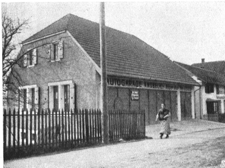
Abb. 12. Die Garage. Mit wenigen Änderungen gemäss dem Heimatschutzvorschlag gebaut. Man beachte das Dach, die Gestaltung der Türen und die Verteilung der Fenster. — Fig. 12. Le garage, élevé avec peu de modifications d'après le projet du Heimatschutz. Remarquer les formes du toit, des portes et la répartition des fenêtres.