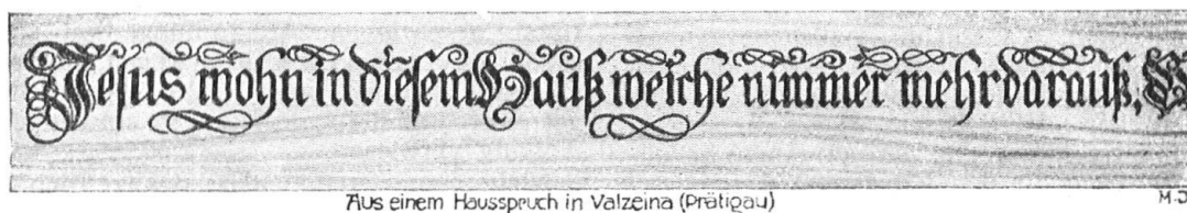
Abb. 13. Spruch an einem Holzhaus im Prätigau. Vorbildliche, geschlossen wirkende Schrift. Fig. 13. Devise sur une maison en bois du Prätigau. Inscription très décorative grâce à l'unité de l'ensemble.