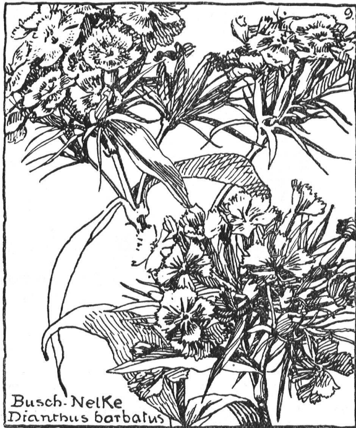
Abb. 8. Verkleinerte Wiedergabe aus „Der Bauerngarten“ von Hermann Christ, illustriert von Maria La Roche. Herausgegeben vom Basler Heimatschutz. — Fig. 8. Reproduction réduite d'une gravure extraite du «Jardin rustique» de Hermann Christ, illustré par Maria La Roche, et édité par la section bâloise du Heimatschutz.

Eine appenzellische Heimatschutzgabe. Das Appenzeller Völklein ist seines fröhlichen Sinnes und seiner Sangeslust wegen bekannt. In nicht minder gutem Sinne zu seiner Eigenart gehört auch seine originelle Tanzmusik (Hackbrett, Violine und Bassgeige), welche man an den öffentlichen Tanzabenden von den Appenzeller Streichmusikanten zu hören bekommt. Wohl kein anderer Kanton hat in seiner Tanzmusik eine solche Mannigfaltigkeit und heitersprudelnde Originalität aufzuweisen. Diesen Volkstänzen schenkte deshalb auch der Heimatschutz schon lange seine Aufmerksamkeit. Sie verdienen sie um so mehr, als die Gefahr besteht, dass sie nach und nach durch fremde, seichte Operettenmusik verdrängt werden könnten. Um dieser Invasion Einhalt zu tun, um das Wertvolle, Köstliche und Unerstzliche unserer heimischen Volksmusik recht vielen zum Bewusstsein zu bringen, um die Pflege alter Appenzeller Musik als eines Stückes heimatlicher Eigenart wieder zu kräftigen, um die