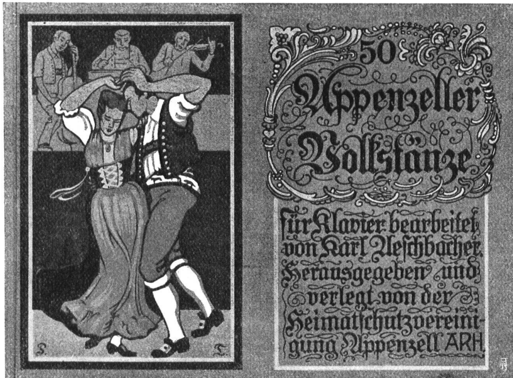
Abb. 9. Verkleinerte Wiedergabe des farbigen Umschlages für die 50 Appenzeller Volkstänze. Entworfen von Paul Tanner, Herisau. — Fig. 9. Réduction de la couverture en couleurs des „cinquante danses populaires d'Appenzell“; composition de Paul Tanner, Hérissau.