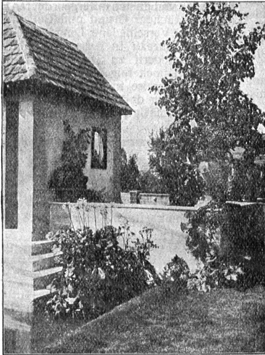
Eine malerische Ecke aus einem unserer Gärten

OTTO FRÖBEL'S ERBEN Gartenarchitekten, ZÜRICH 7