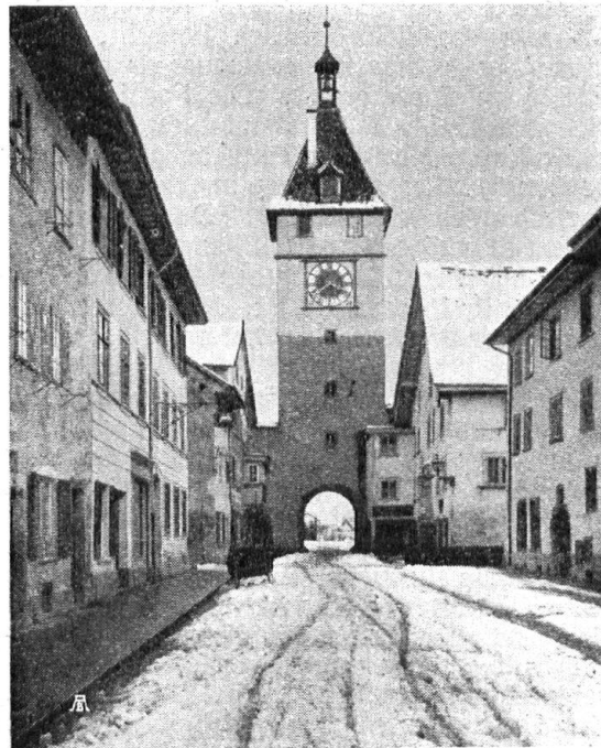
Abb. 16. Obertorturm in Neunkirch. Heutiger Zustand. Die überflüssige Dekorationsmalerei ist beseitigt und der Turm erscheint wehrhaft und schlicht wie ehemals. — Fig. 16. La tour de la Porte supérieure à Neunkirch dans son état actuel. Les décorations superflues ont été supprimés. La tour a beaucoup gagné en retrouvant son air simple et martial.

Mitteilungen aus der Sektion Schaffhausen. 1 Anstrich von Hausfassaden. Der neue Brauch, Hausfassaden mit Oelfarbe zu streichen, hat sich auch in Schaffhausen stark eingebürgert. Die technische Leichtigkeit, eine solche Arbeit durchzuführen, birgt leicht die Gefahr in sich, dass ohne jegliche künstlerische Ueberlegung gehandelt wird. Die Vereinigung der Schaffhauser Architekten will nun hier beratend und korrigierend eingreifen und durch Aufstellen von Grundsätzen den ausführenden Handwerkern eine Wegleitung bei Renovation solcher Häuserfronten geben. Es ist geplant, in einem freien Diskussionsabend zwischen Malermeistern, Architekten und Kunstmalern eine gegenseitige Aussprache über die künstlerische Seite dieses Problems herbeizuführen.