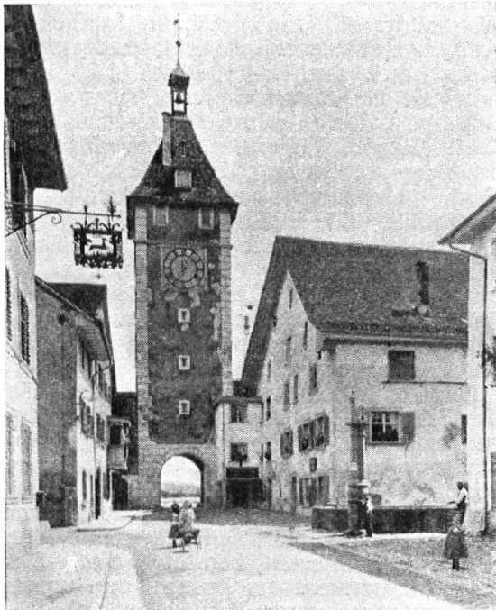
Abb. 15. Obertorturm in Neunkirch. Vor der Wiederherstellung. Man beachte die im Anfang des 19. Jahrhunderts aufgemalte hässliche Quader- und Eckbinder-teilung. — Fig. 15. La tour de la Porte supérieure à Neunkirch, avant la rénovation. Remarquer les laides imitations peintes de pierres de taille.