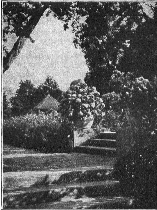
Zugang zu einem Blumengarten

OTTO FRÖBEL'S ERBEN Gartenarchitekten Zürich 7