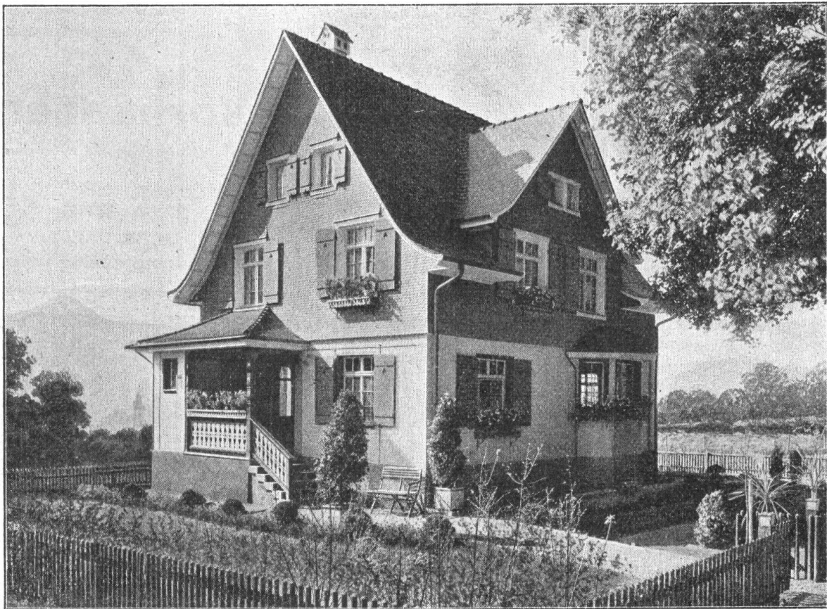
Eternithaus an der Schweiz. Landesausstellung in Bern. Goldene Medaille.

erstellen MOERI & CIE. / ZENTRALHEIZUNGS-FABRIK / LUZERN