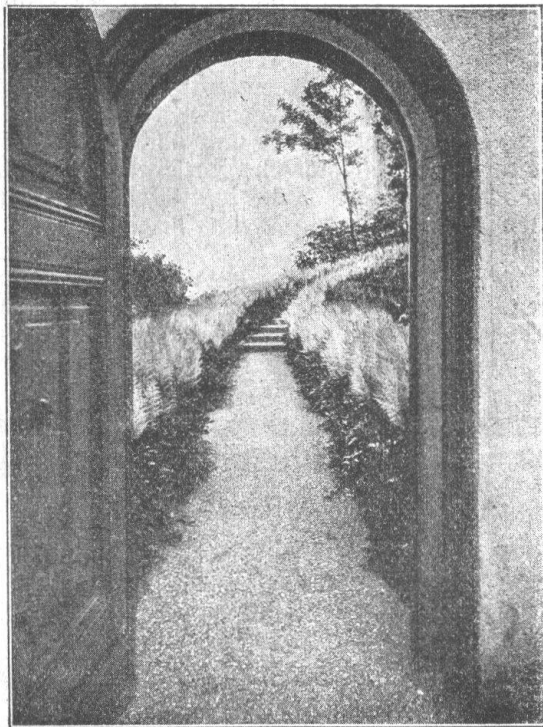
Zugang zum Garten aus dem Hofe

3. In diesem Zusammenhange interessiert wohl auch die hohe Wertung unserer Bestrebungen durch die stadtbernerische Finanzdirektion in ihrer Botschaft zur Berner Theaterfrage: „Unter den Mitteln zur Verbreitung der ästhetischen Kultur, ohne deren Pflege die Gefahr einer Verrohung des Volkes mit den technischen Fortschritten, ja sogar mit der wirtschaftlichen Besserstellung der Klassen,