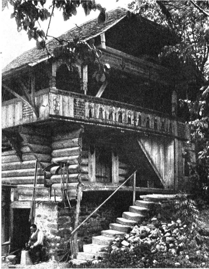
Abb. 11. Der „Zehn-Jungfrauen-Speicher“ in Goldbach bei Lützelflüh. Mit bemerkenswerten schmückenden Malereien, die der Gegenwart unlängst wieder geschenkt wurden. — Fig. 12. Le „grenier des dix vierges“ à Goldbach, près Lützelflüh, décoré de peintures remarquables qui ont été remises à jour il y a peu de temps.