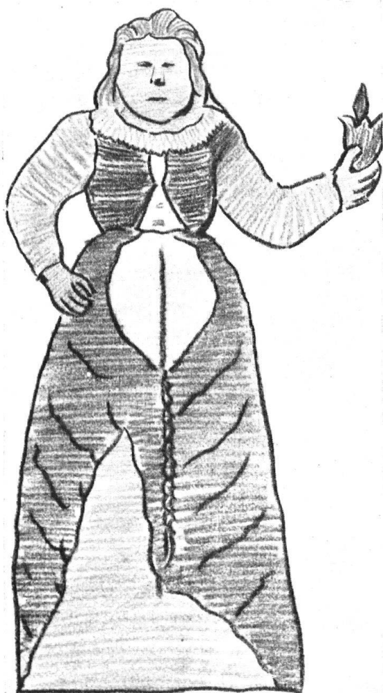
Abb. 10. Eine der Klugen Jungfrauen vom Speicher in Niedergoldbach. Nach einer Farbstiftzeichnung von Architekt A. Brändli, Burgdorf. — Fig. 10. L'une des vierges sages du grenier de Niedergoldbach. D'après un dessin en couleurs de M. A. Brändli, architecte, à Berthoud.

Wenn der verdiente Herausgeber der 100 Bernischen Speicher, A. Stumpf und sein Gewährsmann Pfr. Dr. Friedli, der unermüdliche Bearbeiter des „Bärndütsch“, neuerdings dem Emmental und darin dem Gesichtsfeld Jeremias Gotthelfs ihre heimatschützerische Aufmerksamkeit schenken, so würde in ihren Darstellungen