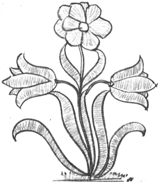
Abb. 14. Blumendekor vom Speicher in Niedergoldbach. Nach einer Farbstiftzeichnung von Architekt A. Brändli, Burgdorf. — Fig. 14. Fleur décorant le grenier de Goldbach. D'après un dessin en couleurs de M. A. Brändli, architecte, à Berthoud.