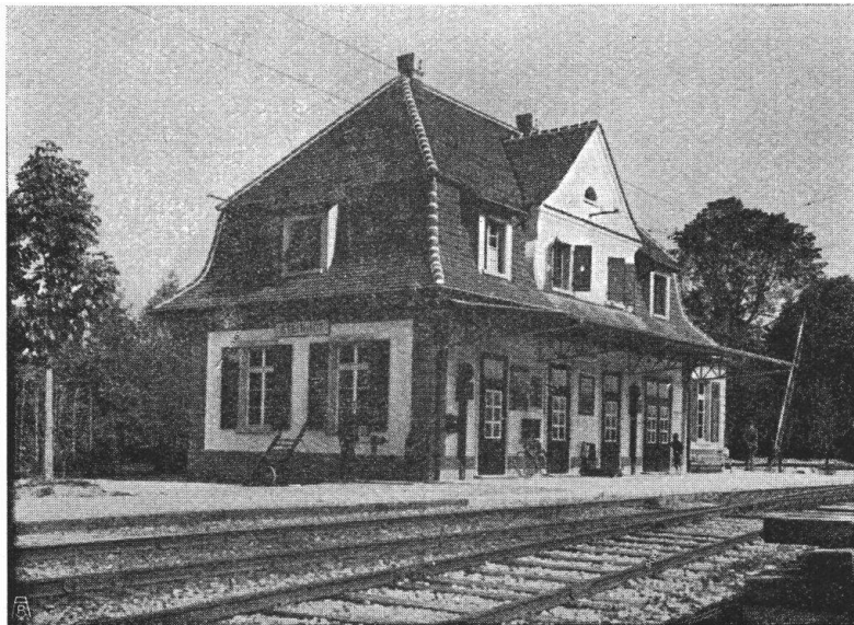
Abb. 19. Die heutige Station „Steinhof“ in Burgdorf. Ein wohlgelungener Neubau. — Fig. 19. La nouvelle station „Steinhof“ à Berthoud. Bâtiment moderne très réussi.

Wir hoffen, dass der ernste, gute Geist, der über allen Veranstaltungen schwebt, auch die Besucher und Gönner derselben beseelen