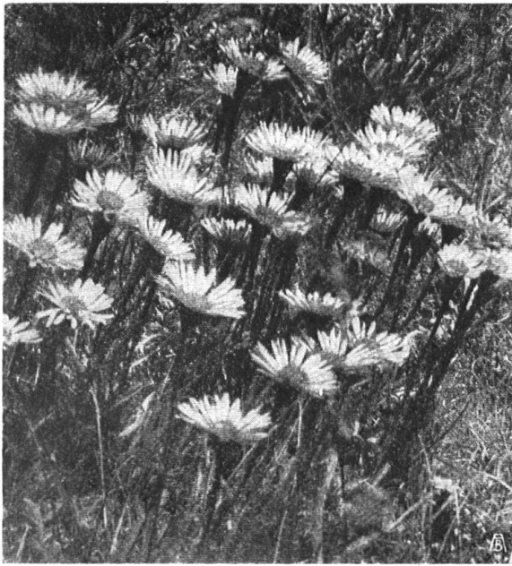
Abb. 5. Alpenastergruppe von Murtèr (Val Cluozza, Nationalpark). — Fig. 5. Groupe d'asters des Alpes, à Murtèr (Val Cluozza, dans le Parc national).

Bergstock befestigt und dann in flangen Sprüngen seinen singenden Berggenossen naheilt. Und wirklich, noch knapp vor der Abfahrt des Zuges langt der letzte an, mit einem Siegerblick dem Bahnsteig entlang schreitend. Er ist sich seines Erfolges bewusst, wie sollte er nicht: Seinen Hut schmückt ein ganzer Kranz von blauem Enzian, untermischt mit den herrlich duftenden Felsenaurikeln. Am Bergstock prangt ein Riesenkübel der leuchtenden Alpenrosen; seine Hände vermögen nicht, ihn zu umklammern. Am Rucksack baumeln rechts und links zwei ebensolche, und um den seiner harrenden Anforderungen auf alle Fälle gerecht werden zu können, hat er noch ein gewaltiges Bündel von Alpenrosenstauden