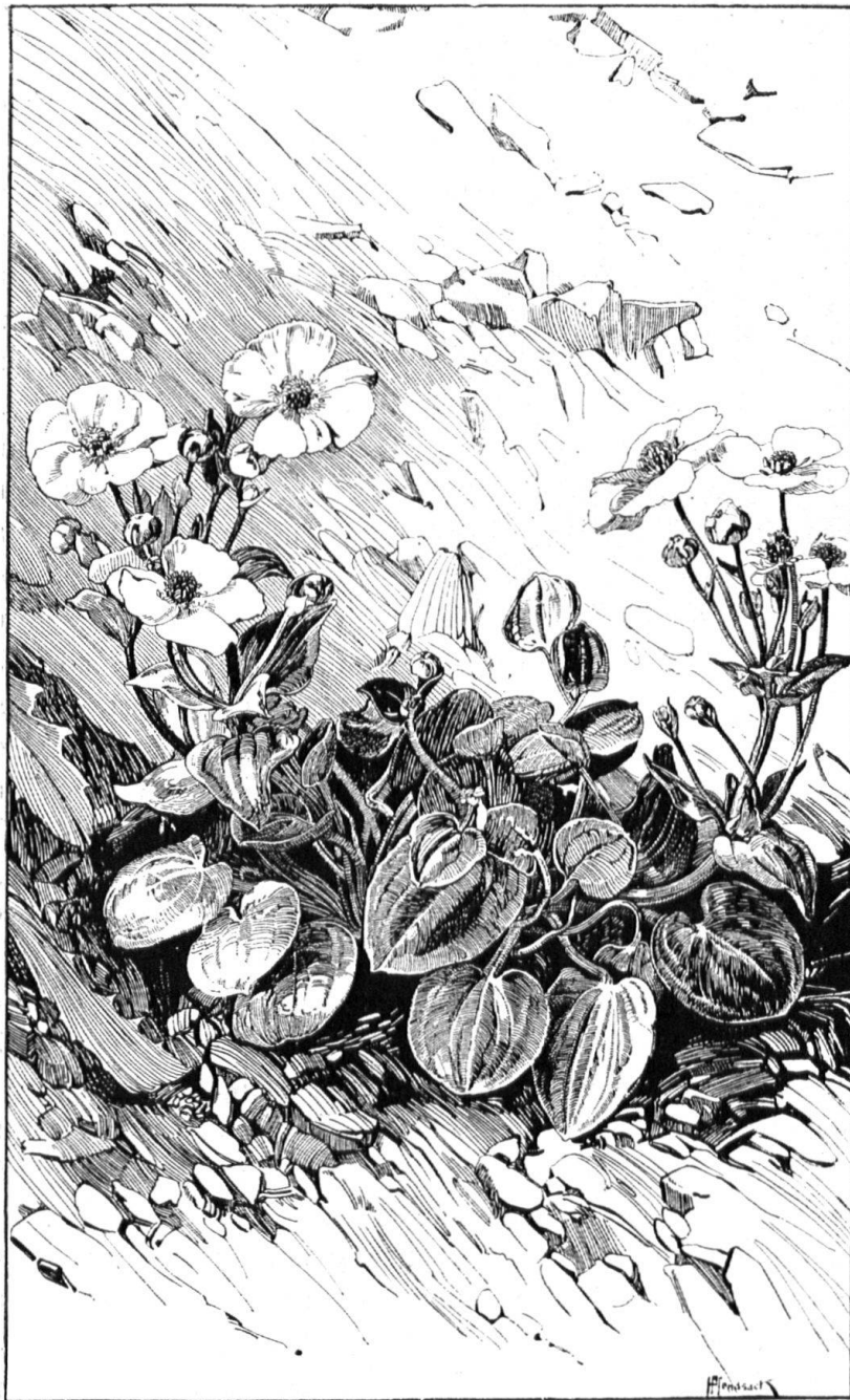
Abb. 4. Herzblatthahnenfuss. Von einer steinigen Halde im Schweizerischen Nationalpark. Klischee, nach Zeichnung von Pfendsack, entnommen der dritten Auflage des empfehlenswerten Buches: Der schweizerische Nationalpark. Von S. Brunies. Verlag Benno Schwabe & Cie., Basel (1920). Aus dem gleichen Buche: die Vignette auf Seite 33. — Fig. 4. Renoncule à feuilles parnassées. Groupe pris dans une pente d'éboulis du Parc national suisse. D'après un dessin de H. Pfendsack, extrait de la 3 e édition de l'excellent ouvrage de S. Brunies: Le Parc national suisse. Benno Schwabe & Cie., éditeurs, Bâle 1920. La vignette de la page 33 est extraite du même volume.