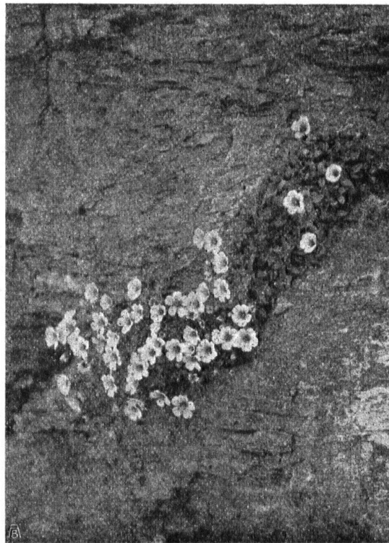
Abb. 3. Breitblättriges Hornkraut. Die Blüten wiegen über die grünen Teile vor. Der ganze Rasen entspringt einer Spalte im Kalkfels. — Fig. 3. Céraiste à larges feuilles. Les blanches fleurettes balancent leurs têtes gracieuses au-dessus du gazon. Toute la colonie est sortie d'une fente de la roche calcaire.

Gebiet der Alpenflora. Auch hier berühren wir eine vielerörterte Frage, wenn wir prüfen wollen, an was es denn liegt, dass die Alpenflora der erklärte Liebling aller ist. Sind es wirklich die satten Farben, die auffallenden Blüten, die edlen Formen? Bis zu einem gewissen Grade sind die angedeuteten Erklärungen zu Recht bestehend. Viele Alpenpflanzen besitzen in der Tat leuchtendere und gleichzeitig auch auffallendere Blüten, als ihre Verwandten im Tale, oder als sie selbst bei der Tieflandskultur hervorbringen. Bei vielen Arten ist ein solcher Vergleich nicht so leicht möglich, dass jedermann die Erfahrungstatsache geläufig wäre. Der Laie wird zudem mehr von der Massenwirkung als von der Einzelbeobachtung geleitet. Die Alpenmatten sind unzweifelhaft blumenreicher und dadurch farbenprächtiger, z. T. eine Folge der geringen Beeinflussung durch den Menschen. Im Tal bedingt die intensive Wiesenkultur das Überwiegen der wenig auffälligen