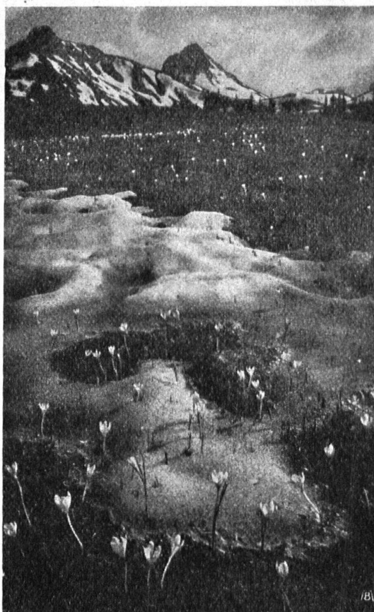
Abb. 1. Das Erwachen der Alpenflora in den Vor- alpen. Krokus als Frühlingsblume, stellenweise sogar durch den Schnee hindurchbrechend. Aufnahme Gyger. — Fig. 1. Le réveil de la flore alpine dans les préalpes. Fleurs de crocus, messagères du printemps. On les voit percer la neige par endroits.

Der Zug in die Berge, dem alljährlich allein im Gebiete der Schweizer Alpen viele Tausende folgen, darf mit einigem Recht mit den jährlichen Wanderungen unserer Zugvögel verglichen werden: beiden ist ein innerer, unwiderstehlicher Drang eigen, der gerade bei uns Schweizern auch im Heimwehgefühl eine Rolle spielt. Wie oft ist schon versucht worden, diese grosse Vorliebe für Gebirgswanderungen zu begründen, sei es mit „der Flucht aus dem Grau des Alltags“ oder mit der Notwendigkeit körperlicher Betätigung in freier Natur und ähnlichen Motiven. Sicherlich kommt diesen Gründen eine gewisse Berechtigung zu, doch werden sie trotzdem ein Gefühl des Nicht-restlos-befriedigt-seins zurücklassen. Die eigene Erfahrung lässt uns die Behauptung wagen, dass das Bergsteigen im Grunde genommen einer biologischen Tatsache entspringt, einer aus dem Wesen unserer menschlichen Triebwelt als innere Nötigung hervortretenden Lebensäusserung, der wir allerdings auch nach andern Richtungen hin Geltung zu verschaffen wissen, aber vielleicht nicht mit dem gleichen ethischen und ästhetischen Erfolg wie im Bergsteigen. Dieser innere Drang, der möglicherweise eine den Menschen besonders kennzeichnende Eigenschaft darstellt, treibt u. a. den Naturforscher mit