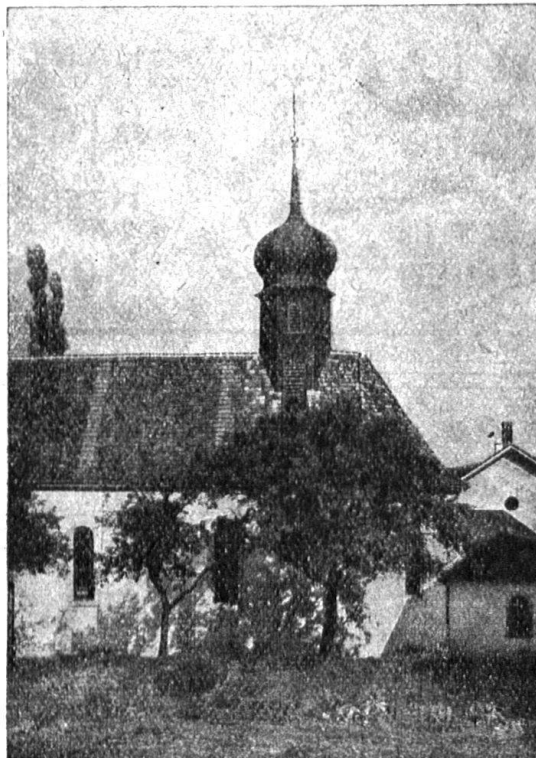
Kirche in Meiringen