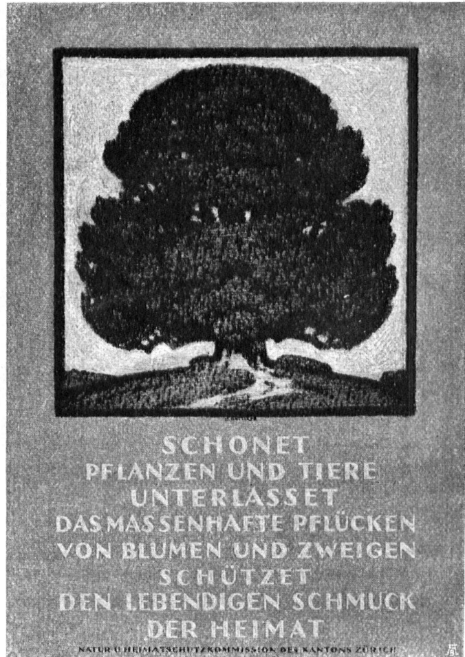
Abb. 12. Naturschutzplakat. Auf Veranlassung der Natur- und Heimatschutzkommission des Kantons Zürich, gezeichnet von Hermann Gattiker; lithographischer Druck der Kunstanstalt Wolfsberg, Zürich. — Fig. 12. Affiche de la Société pour la protection de la nature, Naturschutz, éditée sur l'initiative de la commission zurichoise du Naturschutz et du Heimatschutz. Composition de Hermann Gattiker, lithographie de Wolfsberg, Zurich.

„Wieder lockt der Frühling Scharen von Spaziergängern in die wiedererwachende Natur, und wieder stürzen sich Tausende