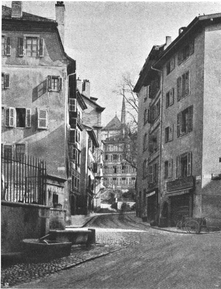
Abb. 3. Genf. Die Rue Saint-Léger. — Fig. 3. Genève. Rue Saint-Léger.

membres y travaillait, les ateliers ou échoppes étant en bas. Les matériaux de construction, ce sont les pierres trouvées sur place, cailloux roulés par l'Arve et le Rhône et liés par un solide mortier. Le toit est simple, dépassant largement sur la rue avec les chevrons apparents; il est couvert de tuiles courbes et plus tard plates, de couleur chaude. Dans certaines rues, le toit s'arrondit en dôme et protège largement la façade. Ainsi faites, les maisons bourgeoises ou populaires n'ont pas l'apparence cossue; elles ont l'air de personnes maigres et dégingandées qui se serrent les unes contre les autres pour éviter le froid. Elles ne paient pas de mine, mais, somme toute, il y fait bon vivre; elles abritent le travail et un certain bon-