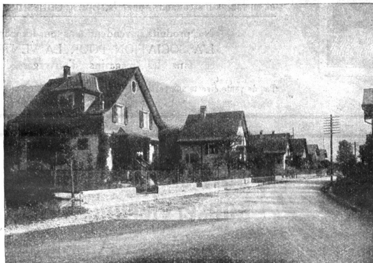
Eternithäuser - Kolonie · (1911-1913 erstellt)