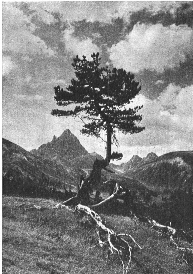
Abb. 1. Aus dem Nationalpark. Val Minger mit Piz Plavna dadaint. — Fig. 1. Une vue du Parc national : le val Minger et le Piz Plavna dadaint.

Die Abwehrbewegung gegen die Zerstörung ursprünglichen Naturlebens, die seit wenigen Jahrzehnten in den meisten Kulturstaaten eingesetzt hat, reicht wohl in keinem andern Lande soweit in die Jahrhunderte zurück wie in der Schweiz. So stammen z. B. die ältesten Bannwaldurkunden aus der Gründungszeit der jungen Eidgenossenschaft in der ersten Hälfte des 14. Jahrhunderts, und sicherlich bestanden ungeschriebene Verordnungen zum Schutze der Waldungen lange schon vorher. Dass aber damals nicht bloss etwa, wie vielfach angenommen wird, die Sorge für die Sicherheit der Siedlungen naturschützerische Massnahmen erforderte, sondern dass schon zu jener Zeit weise Einsicht in die grossen Zusammenhänge des Erschaffenen zu vorsorglichen Verfügungen leitete, beweist am besten die Tatsache, dass z. B. Zürich bereits im Jahre 1335 zum Erlass eines Vogelschutz-