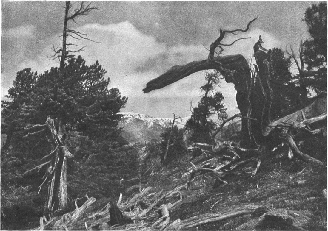
Abb. 6. Urwald im Nationalpark. — Fig. 6. Forêt vierge dans le Parc national.

der landschaftlichen Naturschönheiten“ und einer weitem: „Schutz der einheimischen Tier- und Pflanzenwelt vor Ausrottung“. Während die Naturforscher und die weiten Volkskreise, die sich um sie scharten, sich mit bewundernswerter Energie den grossen Arbeiten widmeten, die Dr. S. Brunies in seinem Artikel kurz skizziert, ist der Heimatschutz mit Belehrung, mit Protest oder mit Ratschlag und materieller Unterstützung eingetreten, in zahllosen Einzelfällen, wo landschaftlichen Naturschönheiten Entstellung und gewinnsüchtige Ausbeutung drohte. Mit dem Schutz der Pierre des Marmettes, des Stazer Waldes, des Matterhorns begann recht eigentlich die Heimatschutzarbeit; Diablerets, Silsersee, Sempachersee folgten, um nur einige Naturdenkmäler zu nennen, für deren Erhaltung der Heimatschutz kämpfte und weiter kämpfen wird. Dann die Bestrebung zum Schutze einzelner Bäume, zur guten Gestaltung von Anlagen, Friedhöfen und Meliorationen; der, auch gesetzlich festgelegte, Landschaftsschutz gegen grobe Uebergriffe von Wasserwerken, der Kampf gegen unnötige oder unschön geführte Freileitungen für Schwach- und Starkstrom. All das gehört zu dem grossen Arbeitsgebiet des Natur- und Heimatschutzes, und manche dieser Aufgaben sind vom Heimatschutz allein, andere vom Heimatschutz und Naturschutz gemeinsam übernommen worden. Das