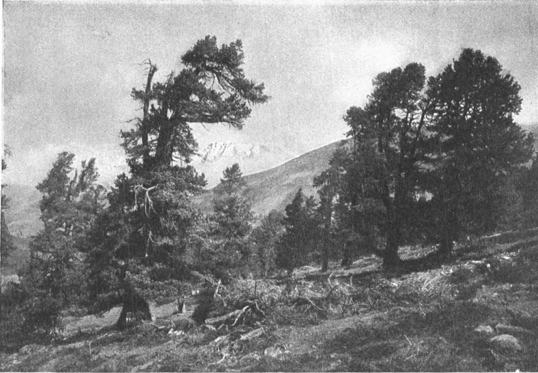
Abb. 5. Arven und Föhren im Nationalpark. Photographie von J. Feuerstein, Schuls. — Fig. 5. Arolles et pins dans le Parc national. Cliché de J. Feuerstein, Schuls

zu erreichen, mehr noch: um unsere Schweizerjugend wieder zurückzuführen zu den Quellen, aus denen unsere Väter Gesundheit und Kraft geschöpft haben, erschien kein Mittel geeigneter, als ihr die Augen zu öffnen über die Gefahren, die die Entweihung unserer Allmutter und die gewinnsüchtige Ausbeute ihrer Schätze mit sich bringt.