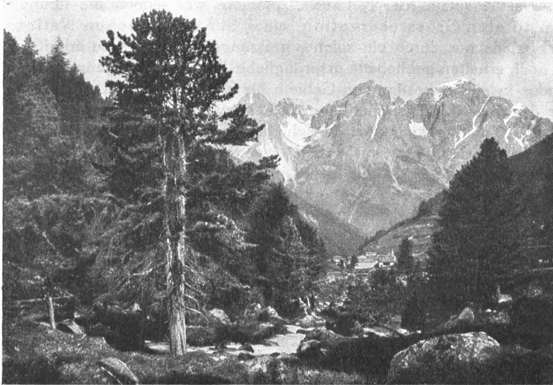
Abb. 2. Scarl mit Pisoc im Hintergrund. — Fig. 2. Scarl et le Pisoc.

wichtiger Naturdenkmäler ernannt. Zugleich wurden in den einzelnen Kantonen Subkommissionen gebildet, deren Aufgabe es zunächst war, Inventare der zu schützenden Naturdenkmäler anzulegen. Kurz zuvor war die Schweizerische Vereinigung für Heimatschutz ins Leben gerufen worden, die, neben der Erhaltung der Eigenart in der überlieferten Bauweise, in Sitten und Gebräuchen, den Schutz der landschaftlichen Naturschönheiten vor jeder Art der Entstellung und gewinnsüchtiger Ausbeute, wie auch den Schutz einheimischer Pflanzen und Tiere vor der Ausrottung zum Ziele hat. Mit Hilfe verschiedener kantonaler Naturforschenden Gesellschaften, der Vereinigung für Heimatschutz, des Schweiz. Forstvereins, des ornithol. Vereins, privater Gesellschaften u. a. m. gelang es, eine grosse Zahl von Findlingsblöcken, ferner mehrere vorgeschichtliche Stätten und erhaltungswürdige Bäume für immer zu schützen. Im Verein mit dem Heimatschutz konnte schon vor einem Jahrzehnt die Entstellung des Silsersees verhindert werden (Crotes Kraftwerkprojekt). In 19 Kantonen wurden Pflanzenschutzgesetze eingeführt. Des fernern konnten in der Folge eine erfreuliche Anzahl von Schutzgebieten (forstliche, botanische, ornithologische und totale Reservate) ins Leben gerufen werden.