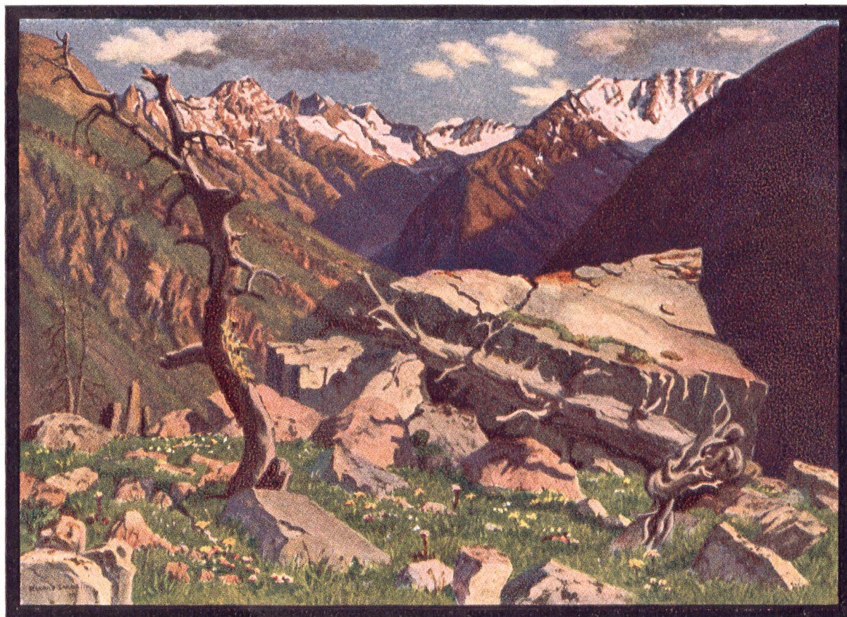
VAL CLUOZA MIT DEN SEITENTÄLERN VAL DEL DIAVEL UND VAL SASSA