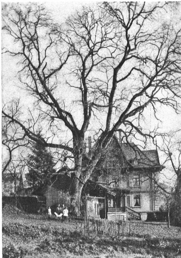
Abb. 9. Der alte, prachtvolle Nussbaum in Wipkingen (Zürich 6), der wahrscheinlich dem Baue des dortigen Kirchgemeindehauses zum Opfer fallen wird. — Fig. 9. Le vieux noyer de Wipkingen (Zurich VI), qui devra probablement être sacrifié pour faire place au nouveau bâtiment paroissial.

«Heimatschutzfreunde aus Ihrer Stadt sind an uns gelangt wegen der beabsichtigten Bebauung des südöstlichen Hügels des «Stein». Ich habe letzthin Gelegenheit genommen, an Ort und Stelle mich umzusehen und bitte mir die Freiheit nehmen zu dürfen, an Sie in dieser Angelegenheit zu gelangen. Es wird wohl nicht zu leugnen sein, dass der Stein dem Städtchen ein ganz besonderes Gepräge gibt dadurch, dass er bis in dieses hinein sich zieht und in überaus trotziger Linie sich darüber aufbaut. Die Ruine als solche bedeutet nicht viel, wohl aber der Grat oder Hügel