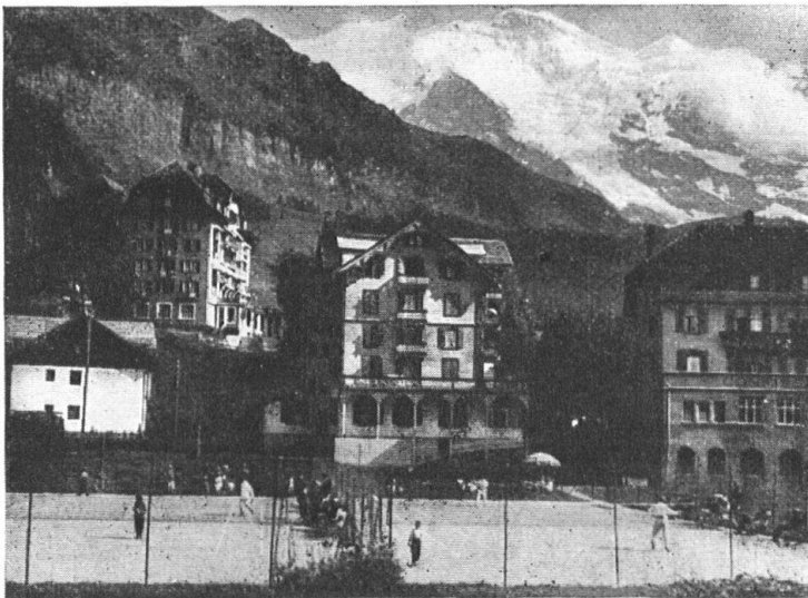
Tennisplätze des Kurverein Wengen

Anlage von Tennisplätzen mit Spezialmergel Dunkelgrüne Absandung