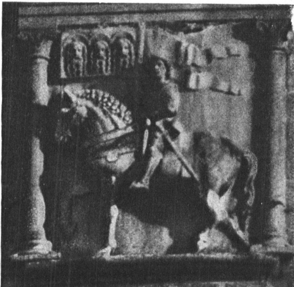
Reiterstatue St. Victor in Muralto

Preis Fr. 1.50. Zu beziehen beim Thurgauischen Helmschutz, Frauenfeld