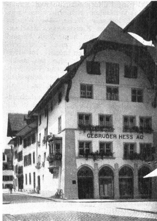
Abb. 21. Das Weibezahlhaus in Aarau, nach dem Umbau. Die Schaufenster sind mit Geschick eingebaut, allerdings der Mittelakzent geopfert. Gut angebrachte Firmenschrift. — Fig. 21. Le Weibezahlhaus à Aarau, après la restauration. Les devantures du magasin ont été habilement réparties entre les piliers. Le nom de la maison de commerce a été mis avec goût.

den Verehrer der vom Zeitalter des Verkehrs und der Industrialisierung noch unberührten Schweizer Landschaft bieten die Dutzende von trefflichen Reproduktionen eine wahre Augenweide. Städtebilder, Landschaften und Darstellungen aus dem Volksleben sind aus dem Geist jener verflossenen Tage geschaffen, wo unser Land und Volk für jeden Fremden mit einem Schimmer von Romantik und einem Hauch von Sentimentalität umgeben war. Künstler, wie Aberli, Freudenberger, Rietter, Weibel, Wetzler, Hegi, um nur die bekanntesten zu nennen, haben die schöne alte Schweiz so wiederzugeben verstanden, wie ihre Zeit und die Besten ihrer Zeit sie sahen. In Umriss-Radierungen, Aquatinten, Lithographien, die in zahlreichen Exemplaren vom Künstler und seinen Schülern koloriert wurden, so dass doch jedem der Blätter etwas von einem Original eigen war, sind diese Ansichten in die Welt hinaus gegangen, für die Eigenart der Schweiz werbend. Heute