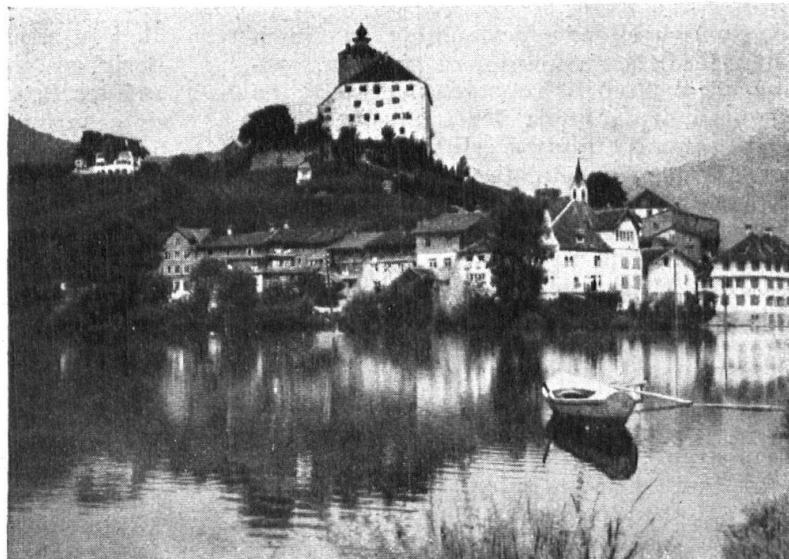
Abb. 17. Werdenberg, Schloss und Städtlein am idyllischen kleinen See, der vor dem drohenden Verlanden geschützt werden soll. — Fig. 17. Werdenberg. Château et ancienne petite ville, qu'il faut protéger contre l'enlaidissement.

La tâche qu'il s'est assignée est immense. Les précieux encouragements qu'il a rencontrés dans les diverses campagnes qu'il a menées prouvent que son œuvre