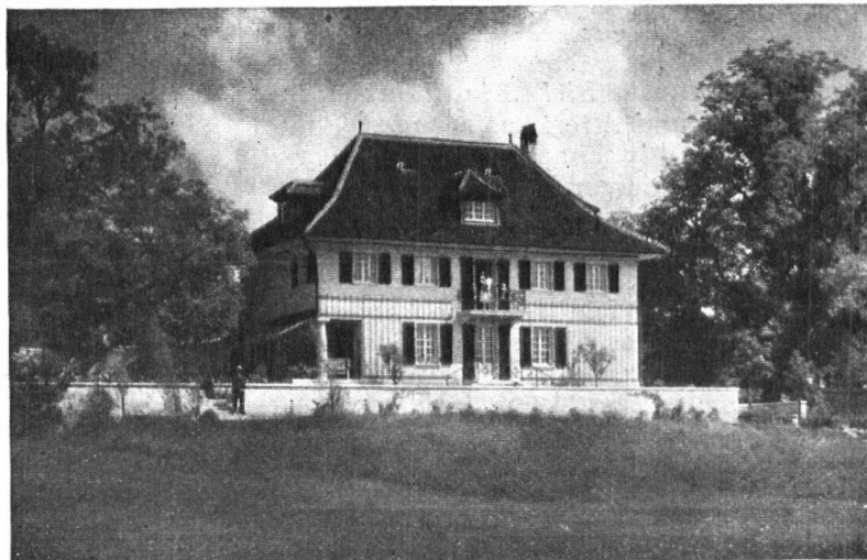
Abb. 17. Geschonte Nussbäume. Neuerbautes Landhaus bei Solothurn. Für die Wahl des Bauplatzes waren die beiden uralten Nussbäume rechts und links massgebend, die nun den schönsten, lebendigen Rahmen für das Haus bilden. — Fig. 17. Epar-gnons les beaux noyers! Maison de campagne, construite dernièrement près de So-leure. Ces deux vénérables noyers, qui maintenant encadrent pittoresquement la villa, ont déterminé l'emplacement de celle-ci.

gen, für die der Wettbewerb nur weglei-tend war und die uns auch nicht aus dem erwähnten Heimatschutzheft bekannt sein konnten. Von weitaus den meisten dieser modernen Grabzei-chen darf man sagen, dass sie mit sicherem Gefühl aus dem Ma-terial gewonnen sind, gefunden, nicht «gesucht». So mögen sie dem Handwerks-meister zu Stadt und Land Anregung ge-ben; die Mappe ist aber auch da, um vom Pfarrer oder Lehrer den Trauerfamilien gezeigt zu werden, die etwa Rat holen für die Schaffung eines Grabzei-chen. Wenn die Veröffentlichung recht oft als Weg-leitung benützt wird, könnte sich man-ches in unserer Friedhofkultur zum bes-sern wenden; die knappen Ausführungen über Rostprozess und Rostschutz, die der Basler Fachlehrer für Schlosserei, F. Herger, zum Ganzen beisteuert, wird auch der Laie mit Gewinn lesen, da die üblichen Befürchtungen wegen Wetterunbeständigkeit der Eisenkreuze durch Exempel aus der Praxis zerstreut werden.