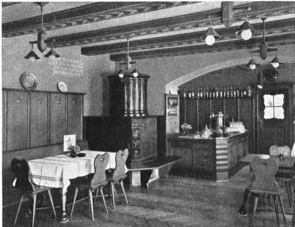
Abb. 7. Gaststube im Erdgeschoss des „Rössli“. Gemütliche Otenecke und Buffetnische gliedern den Raum. Bemalte Balkendecke, kräftig gestaltete moderne Leuchtkörper aus Holz und Messing. Fig. 7. Salle d'auberge au rez-de-chaussée de l'hôtel « zum Rössli » à Augst. Le poêle en faïence, la niche du buffet donnent à ce local un cachet original. Les poutres du plafond ornées de peintures, les lustres modernes en bois et laiton, mais d'un style robuste, sont en harmonie avec l'entourage.