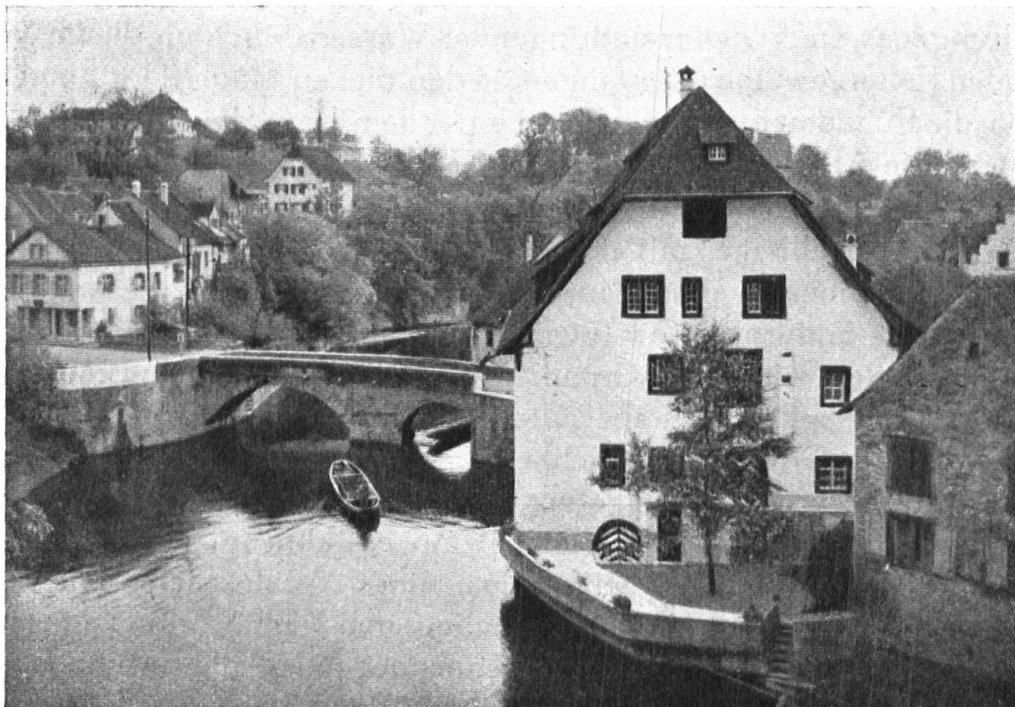
Abb. 4. Das „Rössli“ in Augst. Ansicht von Norden, mit der alten Ergolzbrücke. Vorn rechts ein Nebengebäude, das jetzt auch umgestaltet wird. — Fig. 4. L'hôtel « zum Rössli » à Augst. La façade Nord et l'ancien pont de l'Ergolz. Devant, à droite, une dépendance de l'hôtel, qui doit aussi être rénovée.