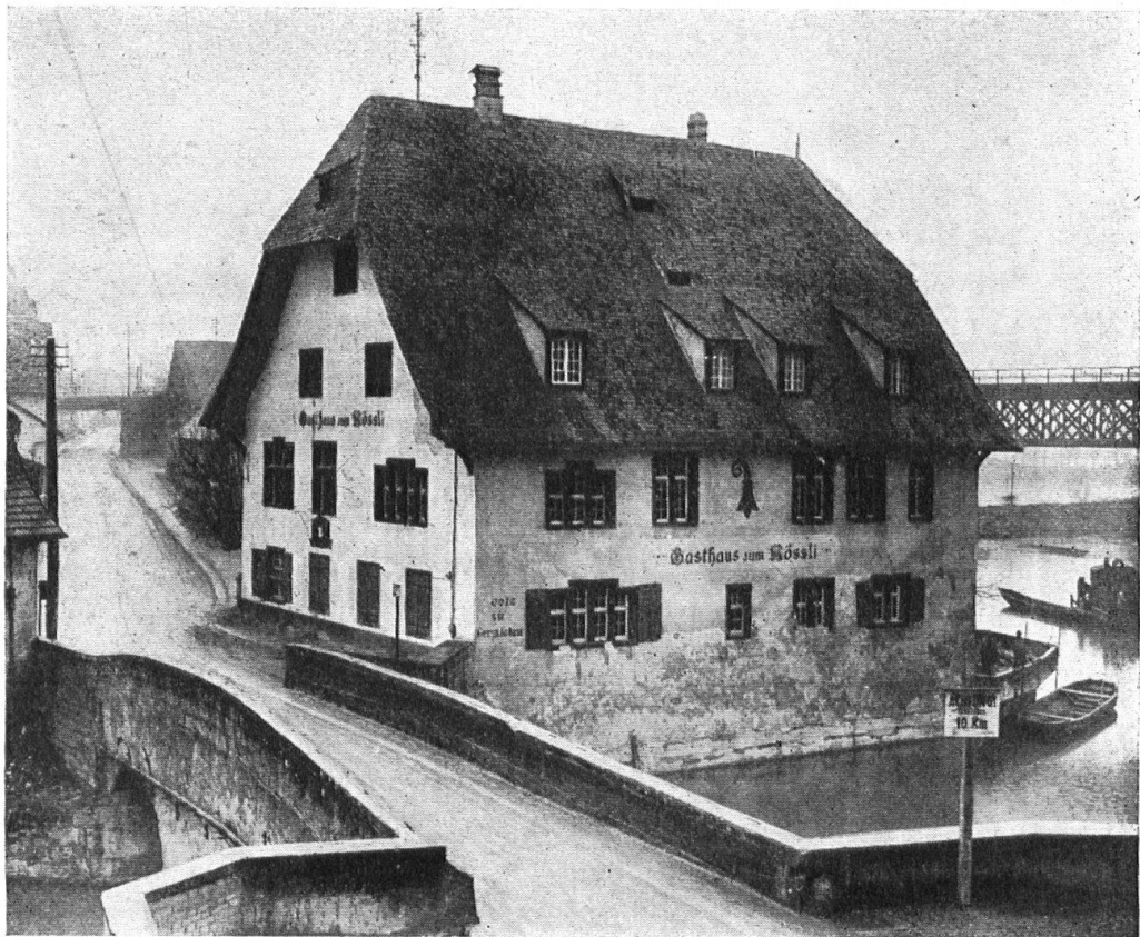
Abb. 2. Das Gasthaus „zum Rössli“ (ehemaliges Zollhaus) an der Ergolzbrücke zu Augst, vor dem Umbau. Zu beachten der Verfall der Mauern, die zu hohen neueren Dachlichter, welche die schöne Linie des Daches unterbrechen. — Fig. 2. L'hôtel « zum Rössli » (ancienne Douane) et pont d'Augst, avant la rénovation. Les murs sont décrépits, les lucarnes, ajoutées plus tard, et trop hautes, apportent une note discordante dans les belles lignes du toit.

übernommen wurden, sondern auch Opfer an Verantwortlichkeit und Aufwand an Zeit, die sich die massgebenden Organe des Elektrizitätswerks wohl hätten fernhalten können, wenn sie einfach den Abbruch des wasserunter-spülten Hauses befürwortet hätten. Zum grossen Glück für unser Heimatbild ist an leitenden Stellen in unsern Gemeinwesen, selbst in wirtschaftlichen Unternehmungen, neben all dem überlegenen Kalkulieren, dem wir ein Stück unserer Wohlfahrt danken, auch ein lebendiges, opferfrohes Gefühl vorhanden, Gefühl für überkommene bauliche und landschaftliche Werte, die noch Generationen etwas sagen werden, etwas erzählen können, was nur in dieser Form, nur an diesem Platze sich ereignete und Gestalt annahm und damit ein Stück Heimatgeschichte, Heimatzugehörigkeit bedeutet, das der beste, aber traditionslose moderne Bau nicht geben kann, mag er auch strengen Anforderungen der Ästhetik vollauf genügen. Gefühlserwägungen, die uns in Zürich das Muraltengut und den Beckenhof retteten, hier in Augst den historischen Landgasthof, lassen sich glücklicherweise nicht mit billigem, überheblichem Spott auf „Heimatschutz-Sentimentalitäten“ wegdisputieren. Dieses positive Schaffen