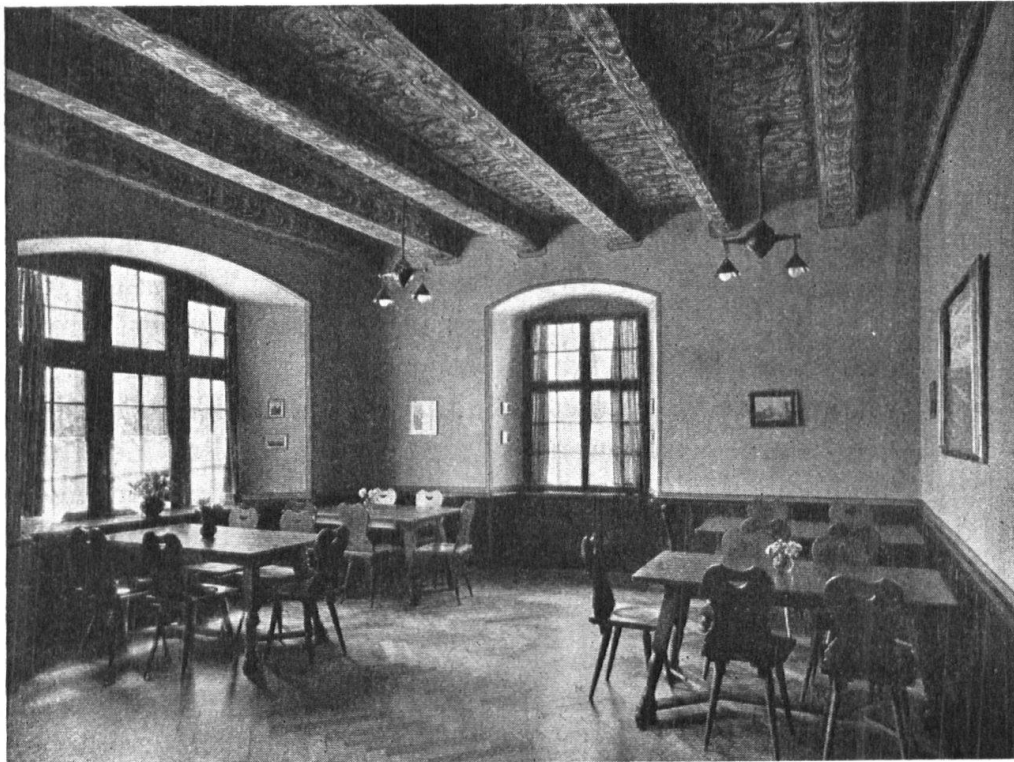
Abb. 9. Der Speisesaal im ersten Stock des „Rössli“, dessen bemalte Decke unter einer Gipsdielen verborgen war. Moderne bemalte Leuchtkörper; Mobiliar, wie im ganzen Hause, in guten ländlichen Formen. Fig. 9. La salle à manger au premier étage de l'hôtel « zum Rössli » à Augst, dont les poutres du plafond et leurs peintures étaient cachées sous un revêtement de plâtre. Lustres modernes peints. Mobilier d'un bon style rustique, comme dans toute la maison.

genug waren früher oft die Resultate, wenn im fertig gestellten Rohbau die Gipser und Maler auf eigene Faust und nach abgenützter Schablone walteten. Unerfreulich auch wird das schmückende Element, wenn der Architekt selbstherrlich alles vorschreibt, dem handwerklichen Können und künstlerischen Erfinden des Malers enge Grenzen ziehend. Erst wenn Baumeister und Malermeister sich gegenseitig anregen, verständigen, wenn Architekt und Dekorateur künstlerische Qualitäten haben, die sich zu einer Schöpfung aus einem Guss einen und steigern, werden erfreuliche Resultate, ohne Zurücksetzung und ohne Vordringlichkeit, erreicht. Gerade diese Zusammenarbeit der Architekten Brodtbeck und Bohny mit dem Maler Adolf Fischer-Müller (Basel) hat im Innern und Äussern des „Rössli“ so viel Harmonisches, Überzeugendes gezeitigt. Architekt und Maler suchten Altes mit Neuem zu einen und mit gleicher Liebe da und dort ganz modern leuchtende Farben zur Geltung zu bringen; dann wieder die freigelegte alte Deckenmalerei im Speisesaal zu erhalten, stückweise mit feinsten Anpassung zu ergänzen, als Exempel einer seltenen Art etwas derber aber ganz ursprünglicher Dekorationsmalerei in reicher Abstufung gelblicher Gesamttöne. Wie für die farbenfreudige Ausgestaltung des Innern dürfen Architekt und Maler auch für die Fassadenmalerei gemeinschaftlich zeichnen, deren