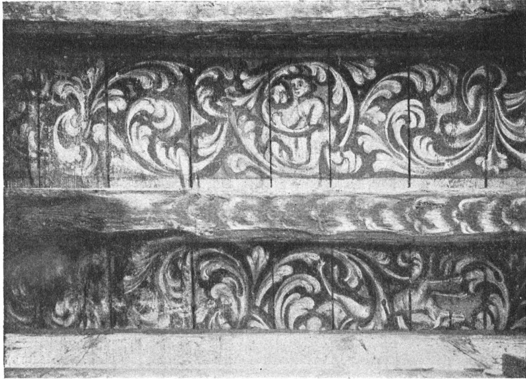
Abb. 8. Fragment der Holzdecke im Speisesaal mit Blattranken und Figurendekor im Geschmack des 18. Jahrhunderts. Die Decke ist durch den Umbau blossgelegt, jetzt wieder zur Geltung gebracht und mit künstlerischem Geschick ergänzt worden. — Fig. 8. Fragment des peintures du plafond de la salle à manger, qui ont été remises à jour lors de la rénovation du bâtiment: Ornaments, feuilles et figures dans le goût du XVIIIe siècle, ont été restaurés et complétés avec art.

überlegte Ausgestaltung, welche die alte Form mit neuen Einfällen taktvoll zu einen wusste, Erhaltenswertes schonend und in seiner Wirkung steigernd. Unsere Bilder mögen einen Begriff geben von der heimeligen, altschweizerischen Gesamtstimmung, die aus diesem Umbau lebendig geworden ist. Balkendecken, die eine undankbare Zeit mit Gips verkleidete, sind wieder zur Wirkung gelangt; die neue Gaststube ist wohnlicher geworden als es die alte in den letzten Jahren war: um einen stattlichen Kachelofen, für den der Platz eigentlich gegeben war, bildet sich eine gemütliche Ecke; bemalte Unterzüge gestalten die Decke abwechslungsreich; für das Büffet wurde eine Nische geschaffen. Schon in der Gaststube, dann im neu geschaffenen Säali an der Nordostecke des Hauses, das durch eine Balkendecke mit eigenartigem farbigem Flammenmuster, durch Holzgetäfer in aparter rot-schwarzer Tönung seine eindruckliche Stimmung erhält, gibt man sich darüber Rechenschaft, dass die Architekten im Maler jedenfalls einen künstlerischen Mitarbeiter hatten, der mit originellen Ideen und nicht alltäglichem Können zum Gelingen des Ganzen mitwirkte. Es ist ein erfreuliches Moment im neuern Bauen, dass Architekt und „Dekorateur“ Hand in Hand arbeiten und dass damit der farbige Schmuck wirklich organisch aus dem Bau herauswächst. Unerfreulich