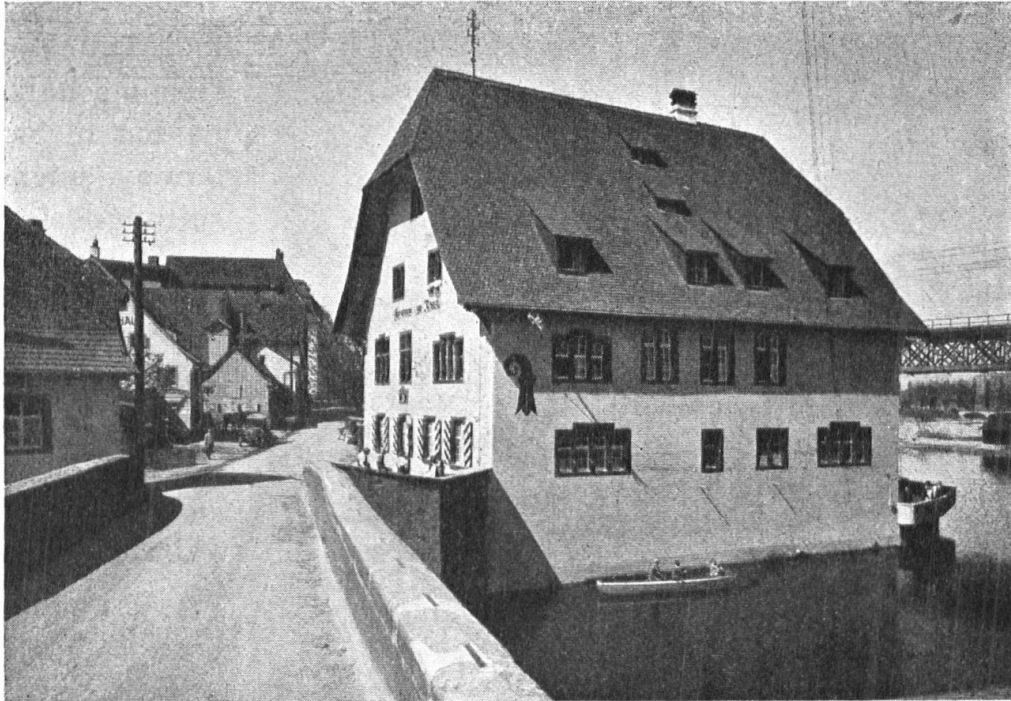
Abb. 3. „Gasthaus zum Rössli“ in Augst, nach dem Umbau. Blick von Osten her. Das Mauerwerk konsolidiert, die Dachlinie geschlossener gestaltet, gute neue Fensteranordnung. Belebung und Aufhellung des Baues durch gute Bemalung der Fassaden, Läden, kräftige Schriften und Hauszeichen. Bauherr: Elektrizitätswerk Basel; Architekten Brodbeck und Bohny, Liestal und Basel; Maler A. Fischer-Müller, Basel. — Fig. 3. L'hôtel « zum Rössli » à Augst, après la rénovation. Vue prise du côté Est. Les murs ont été consolidés, la toiture a retrouvé un aspect homogène, la disposition des fenêtres est meilleure. Les façades sont peintes en couleurs claires; enseignes et inscriptions sont traitées avec vigueur. Propriétaire: Entreprise d'électricité de la ville de Bâle; architectes: MM. Brodbeck et Bohny, Liestal et Bâle; peintre: A. Fischer-Müller, Bâle.