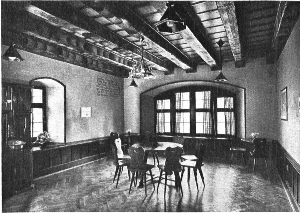
Abb. 6. Das „Säleli“ im „Rössli“ zu Augst. Durch den Umbau neu gewonnener Raum. Balkendecke mit Flammenmuster bemalt. Moderne Beleuchtungskörper in Messing, alter Mittleleuchter in vergoldetem Schmiedeeisen. — Fig. 6. La « petite salle » de l'hôtel « zum Rössli » à Augst. Espace gagné par suite de la transformation du bâtiment. Plafond à solives visibles, ornées de peintures originales. Lustres modernes en laiton, un lustre ancien en fer forgé doré.