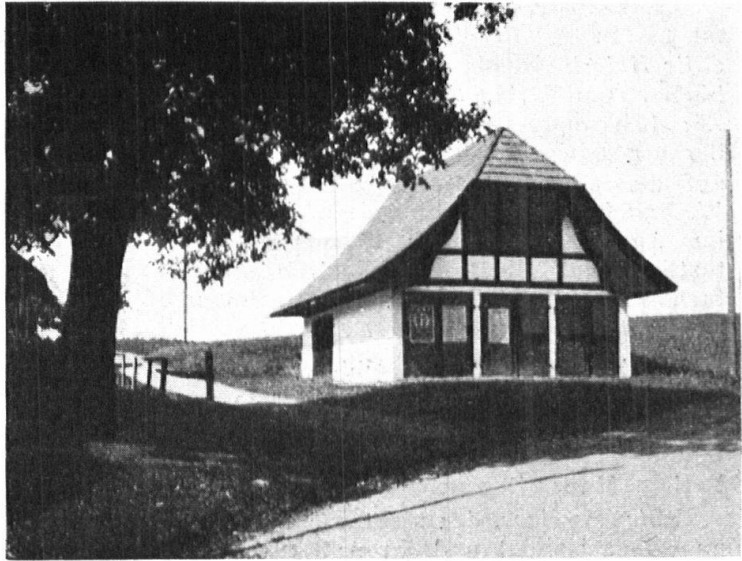
Abb. 14. Gutes modernes Spritzenhaus in Büren zum Hof, Kanton Bern. Auf der Reproduktion kommen leider nicht alle schönen Einzelheiten gut genug zum Ausdruck. — Fig. 14. Bon dépôt moderne de matériel de sapeurs-pompiers à Büren zum Hof, canton de Berne. Malheureusement la reproduction ne rend pas suffisamment bien tous les jolis détails.

Die Basaltbrüche am Hohenstoffel. Wie den süddeutschen Tageszeitungen zu entnehmen ist, sind in neuester Zeit die Arbeiten für die Ausbeutung des Basaltbruches am bad. Hohenstoffel, der neben dem Hohentwiel zu den schönsten und meistbesuchten Aussichtspunkten des benachbarten Hegaus zählt, in intensivster Weise wieder aufgenommen worden. Bereits sind die Ruinen der einstigen Feste auf der einen Kuppe des Berges gesprengt und eine klaffende Wunde am Berg gibt Zeugnis von der fortschreitenden Verwüstung des Landschaftsbildes. Nun soll in allernächster Zeit eine grössere Aktion gegen die Weiterführung dieser Arbeiten eingeleitet werden. An dieser Eingabe an die Behörden wird sich in nachbarlicher Solidarität auch die Sektion Schaffhausen der Schweizerischen Vereinigung für Heimatschutz anschliessen. Leider bieten die deutschen Gesetze keine genügende Handhabe, um eine weitere Abtragung des einen Gipfels des Hohenstoffels zu verhindern, wie sie z. B. das Schweizerische Zivilgesetzbuch in Artikel 702 kennt. So schreibt der Badische «Alb-Bote»: Die Hegauberge sind Privatbesitz, und nach den bestehenden Gesetzen kann man die Eigentümer nicht hindern, diese Berge abzutragen, obwohl sie als Erscheinung der Allgemeinheit gehören und ein Teil unserer Heimat sind. Um nun der rücksichtslosen Ausbeutung des Basaltbruches am Hohenstoffel aber etwas Einhalt zu tun und den staatlichen Organen Gelegenheit zu geben, noch mit