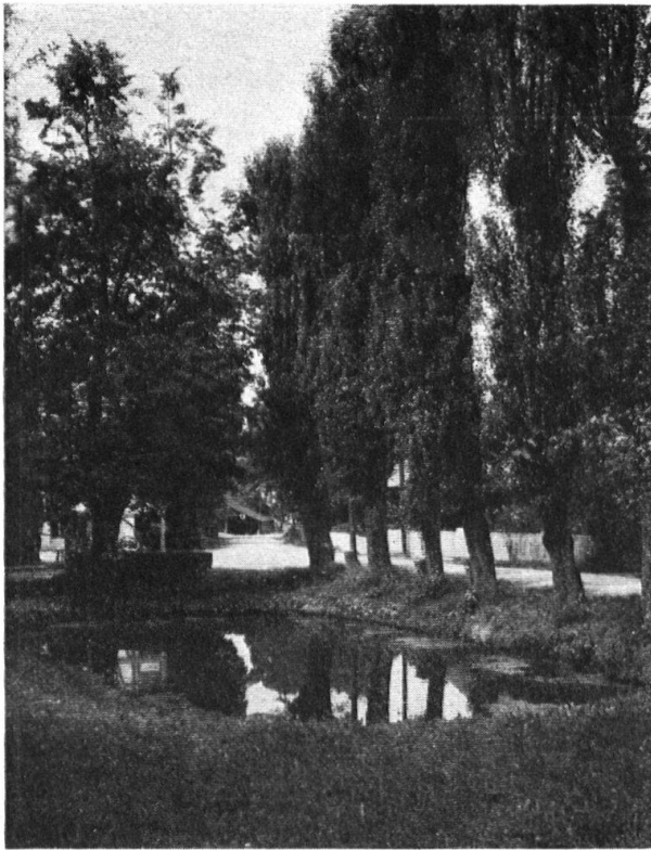
Abb. 13. Guter Feuerweiher in Ruppoldsried, Kanton Bern. Derselbe ist eine Zierde des ganzen Dorfes. — Fig. 13. Bon étang à Riedbach dans le canton de Berne; il représente le plus bel ornement de tout le village.

nicht nur vom praktischen Standpunkte aus unverantwortlich, indem die Vögel die natürliche Art der Schädlingsbekämpfung darstellen; auch vom Standpunkt des Idealen dürften wir für die gefiederten Freunde mehr tun, die uns doch tagaus, tagein die schönste Musik bieten. Im Aaregrien (zwischen Lyss und Aarberg) ist nun auf Ansuchen der Schweiz. Gesellschaft für Vogelkunde und Vogelschutz ein Gebiet in der Bewirtschaftung den Ansprüchen des Vogelschutzes untergeordnet worden. Dank dem erfreulichen Entgegenkommen der Gemeindebehörde von Aarberg kann so eine vorzügliche Brutreservation geschaffen werden. Auch das ganze Gebiet des Lobsigensees ist von der Gemeindebehörde von Seedorf der Gesellschaft zur Verwaltung als Brutreservation übergeben worden.