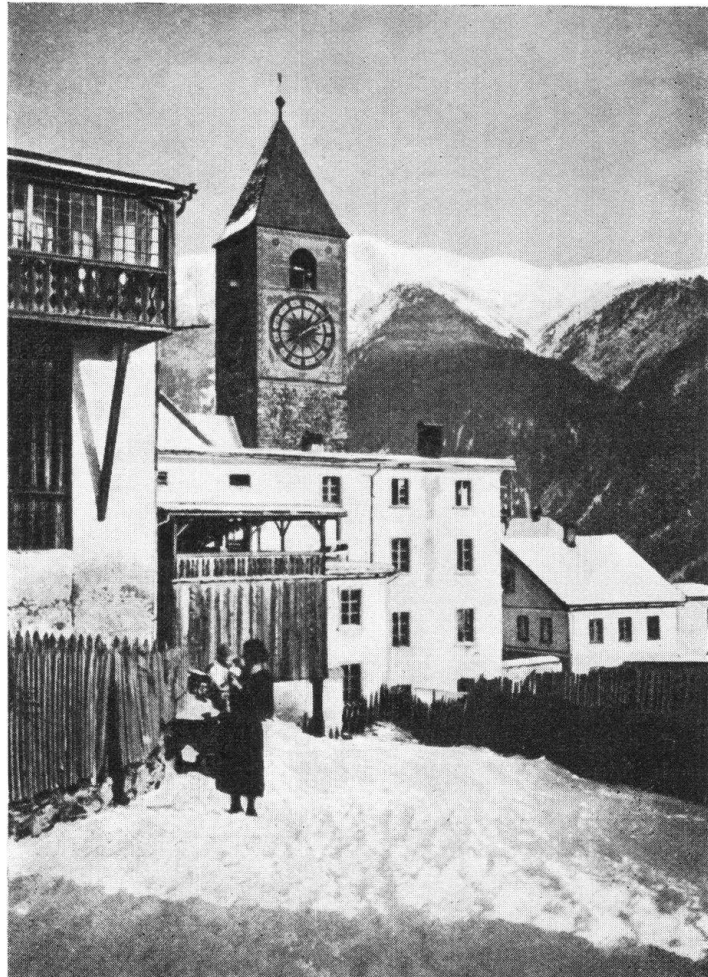
Abb. 16. Die Kirche zu Remüs, mit neuerdings mustergültig wiederhergestelltem Turmhelm. — Fig. 16. L'église de Remüs, nouvellement restaurée, solution excellente.

Die zärtliche weite Mulde des sonnigen Saanenlandes wird von zwei treuen Wächtern beschirmt, die als seine Wahrzeichen gerade durch ihre barocke Gegensätzlichkeit das Erinnerungsbild begrenzen: der breiten behaglichen Gumm-