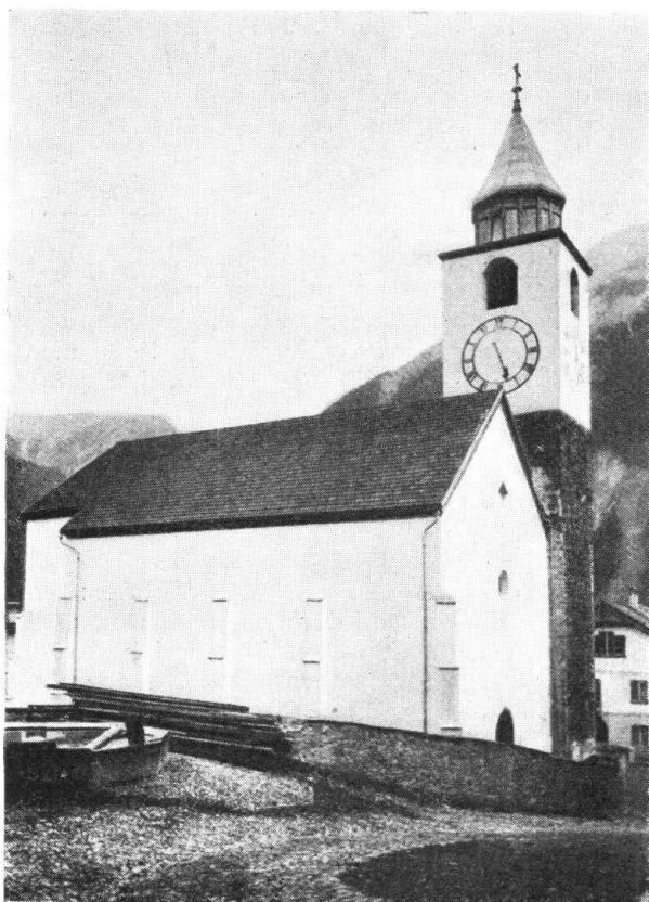
Abb. 15. Die Kirche zu Remüs mit dem, 1883 erneuerten, Turmhelm, in wenig befriedigender Lösung. — Fig. 15. L'église de Remüs et son clocher tel qu'il a été restauré en 1883, solution peu satisfaisante.

Bauten der Technik. In dem derart fast zu einem Glaubenskampfe ausgebildeten Streit um die neue Bauweise, dass den ihr Abgeneigten, ja schon den bloss Lauen nicht nur mangelndes Verständnis, sondern so etwas wie geringeres ethisches