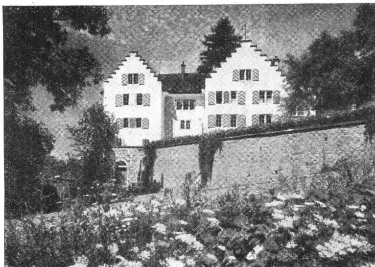
Abb. 4. Schloss Eigenthal am Irchel. Ein freundlicher Wohnsitz in anmutiger Landschaft. — Fig. 4. Le château d'Eigenthal, sur l'Irchel. Restauré et transformé en habitation moderne de noble apparence.

Der Heimatschutz hegt sodann fürsorgende Teilnahme für das Schicksal der Burgen und Schlösser . Die stattlichen Wahrzeichen der verschwundenen Feudalzeit hatten im vorigen Jahrhundert leider nur wenige verständnisvolle Hüter, so dass manche in verwahten Zustand verfielen. Das Erwachen der Heimatideen und