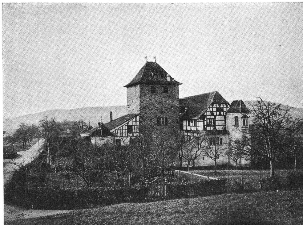
Abb. 3. Schloss Hegi. Südwestseite. Stattliche Burganlage bei Winterthur. Nach der gelungenen Restaurierung von 1924. — Fig. 3. Le château de Hegi vue du Sud-Ouest. Après l'heureuse restauration de 1924.

ausgeführt wird, der jeweilen Tausende von Zuschauern erfreut und dem Klaustag ein bestimmtes Gepräge gibt. Der gleiche Heimatschutzfreund veranstaltet jedes Jahr im dortigen Quartier einen Räbeliechtli-Umzug der Schulkinder mit Tambouren und Handharmonikaspielern.