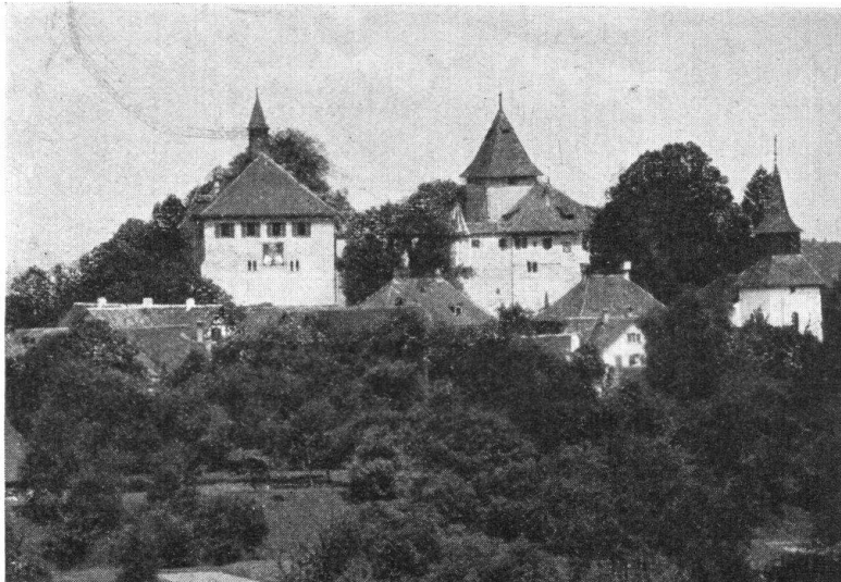
Abb. 2. Die Kiburg, die schönste und grösste Burg der Ostschweiz. Mit staatlichen Mitteln 1925 und 1926 erfolgreich umgebaut und wiederhergestellt. — Fig. 2. Le château de Kibourg dans l'Oberland zurichois, un des plus anciens châteaux-forts de la Suisse. Restauré avec succès en 1925 et 1926 aux frais de l'Etat.

ist. Dass man sogar in städtischen Kreisen gutenländlichen Bräuchen Eingang verschaffen kann, bezeugt das Beispiel in Wollishofen, wo seit 1921 jährlich am Klaustag durch ein Mitglied unseres Heimatschutzvorstandes ein Umzug von etwa 70 Kläusen mit weißen Hemden, leuchtenden Kappen, Schellen- und Hörnerklang nach der Altstadt von Zürich