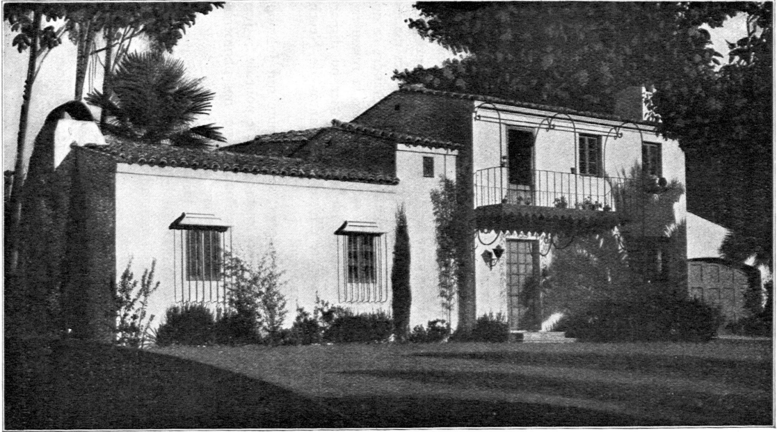
Landsitz in Pasadena, Kalifornien.— Maison de campagne à Pasadena, Californie.

.... leider nicht im Tessin .... qu'on ne rencontre malheureusement pas au Tessin