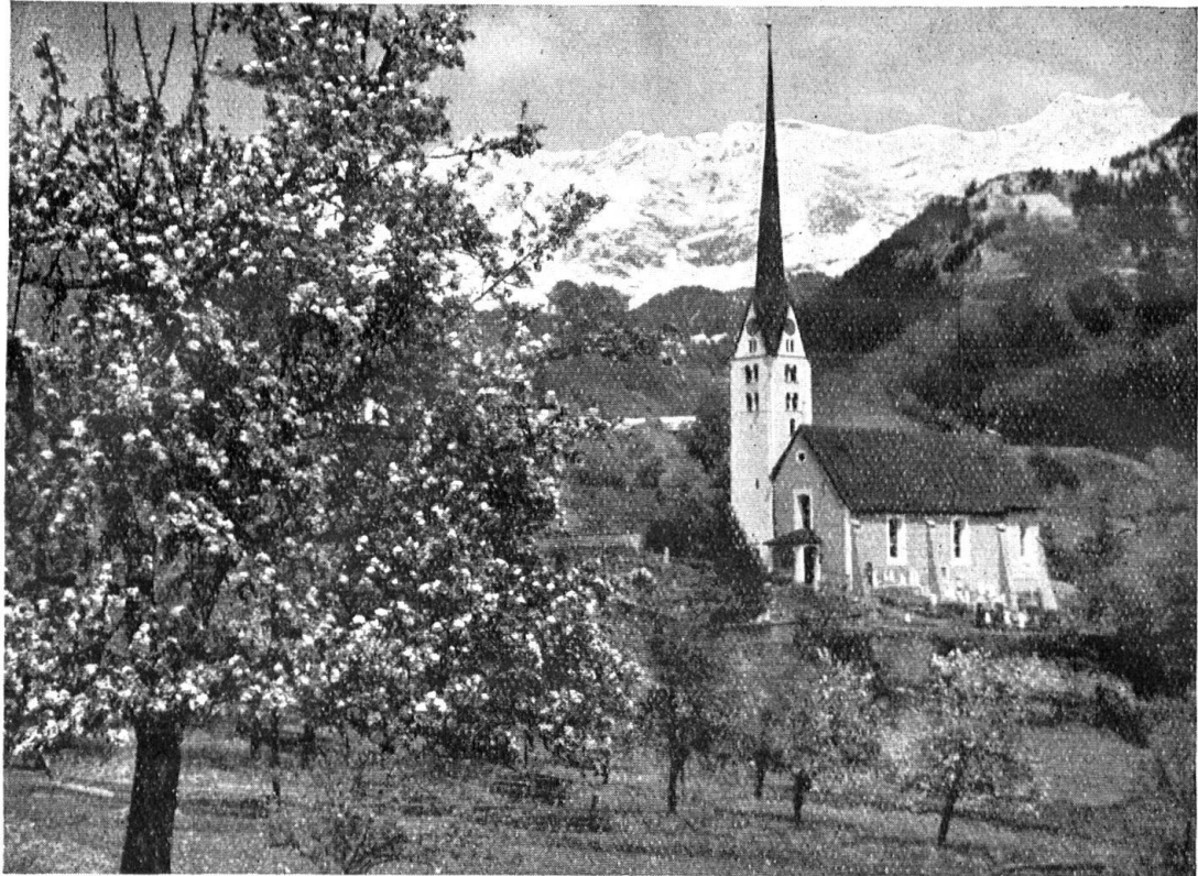
Frühlingsstimmung in Seewis i. P.

„Traute Heimat meiner Lieben, Denk ich still an Dich zurück Wird mir wohl, und dennoch trüben Sehnsuchtstränen meinen Blick.“