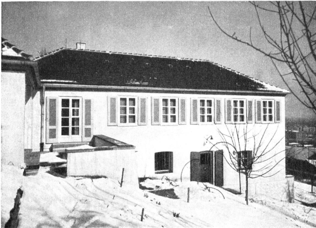
Landhaus am Hang.