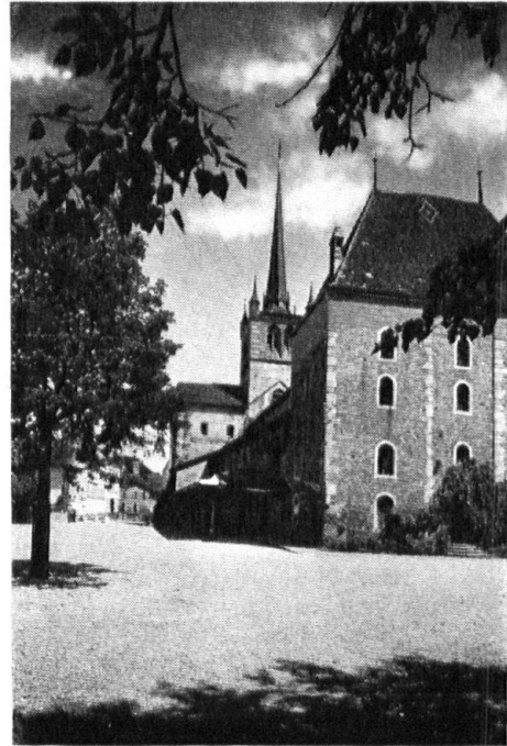
Payerne. Le Cloître.

Le XIXe apporta à Payerne comme à beaucoup de nos cités des transformations multiples et banales, peu d'enrichissement artistique. Il ne fut pas stupide, ce siècle, comme l'a dit avec passion un pamphlet célèbre. Mais riche de découvertes et d'espoirs, emporté par un besoin de vie intense et tumultueux, il ne parvint pas à mettre de l'ordre dans ses créations. On élargit les rues, on construit des maisons, on en détruit d'autres. Les anciennes portes de la ville, une grande partie des remparts tombent sous la pioche des démolisseurs. Des vestiges de fortifications, deux tours ont heureusement échappé. Dans ces