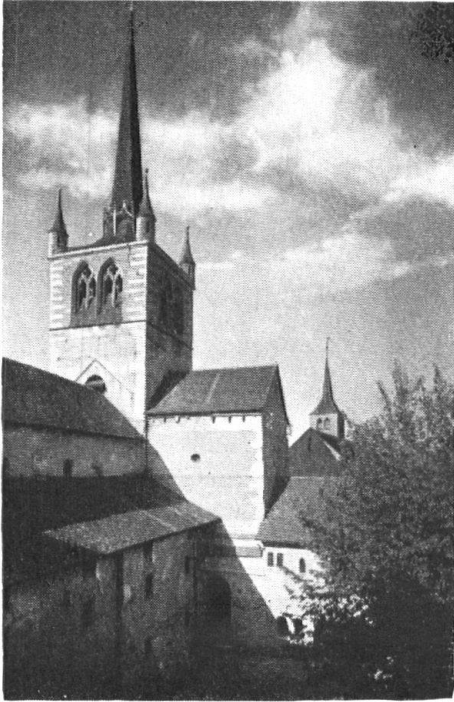
Payerne. Abbatale. Cour intérieure.

Cité agreste et laborieuse, baignée de paix rustique, Payerne est la gardienne vigilante de souvenirs glorieux et de remarquables monuments.