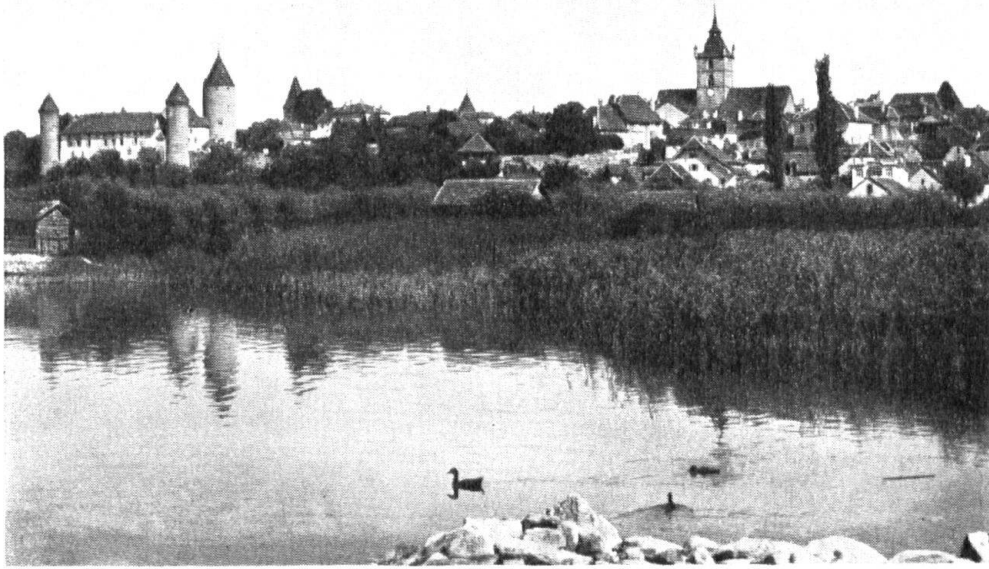
Estavayer. Vue générale.

le vindicatif qui tua en un duel Othon de Grandson, et Claude qui défendit avec courage sa ville et périt héroïquement. Le castel flanqué d'un donjon massif et gris, escorté de tours aux briques roses offre l'illusion d'un château fort avec ses fossés, ses restes de pont-levis, ses dentelles de mâchicoulis. Le clocher de l'église a une apparence belliqueuse; avec ses échauguettes en poivrière d'où monte un toit pyramidal et tronqué, on le prendrait pour un beffroi. Même le paisible monastère de Saint-Dominique, d'où depuis tant de siècles s'élèvent des psalmodies jamais interrompues et où Lacordaire séjourna, a des tours guerrières.