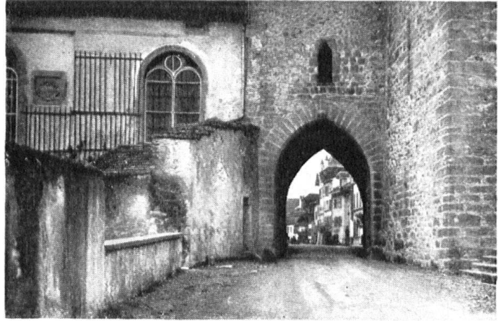
Estavayer. Porte des Dominicaines.

considérer à loisir. Ici c'est une auberge au vaste toit, aux galeries circulaires, le type des bonnes hôtelleries de l'époque des diligences; là, c'est une maison gothique aux fenêtres à meneaux. A de robustes contreforts s'appuie une élégante chapelle, qui conserve en son chœur la dépouille d'une noble baronne de Gorgier. Sur la place de Moudon, un tilleul colossal, contemporain de Charles le Téméraire, domine la ville basse.