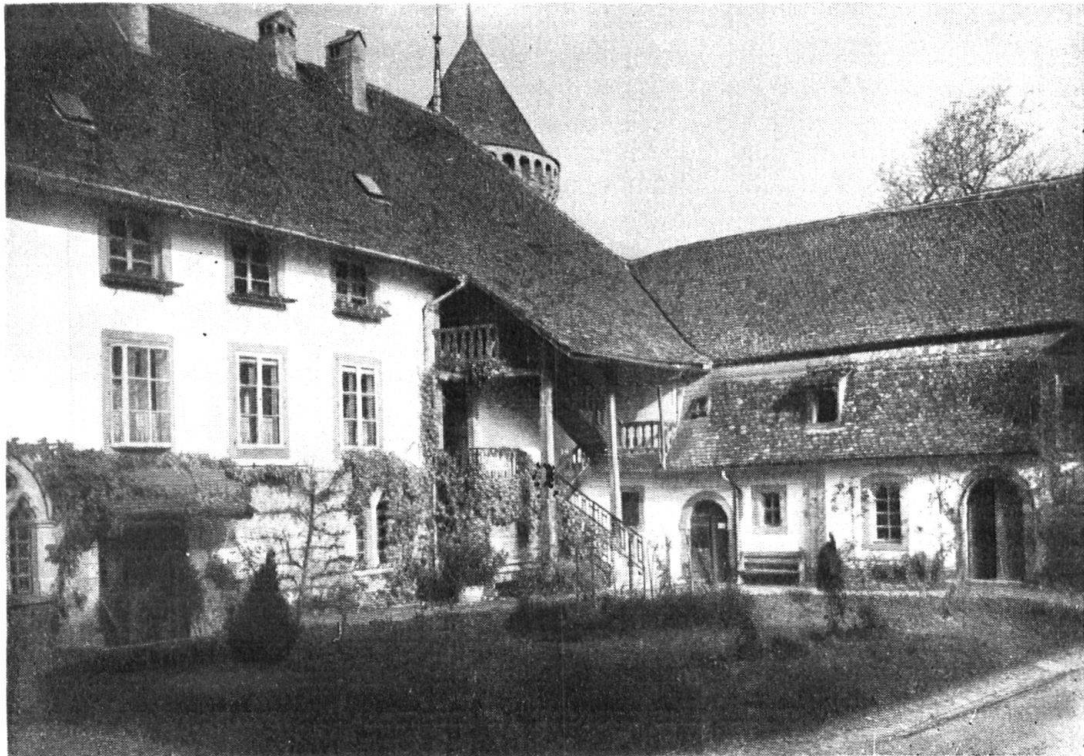
Cour du Château.