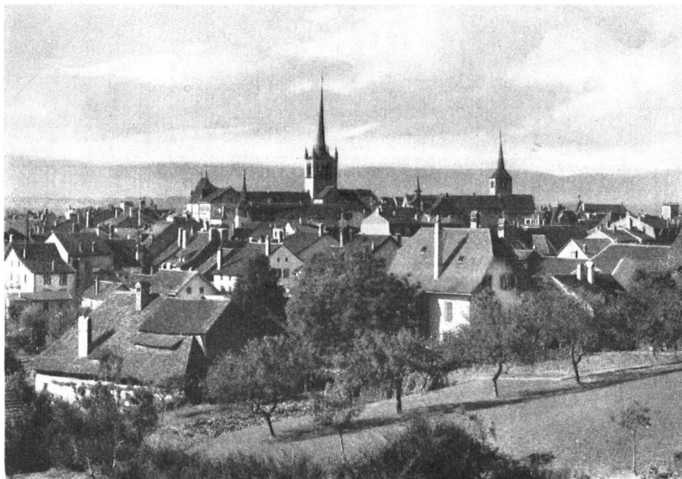
Payerne. Vue générale.