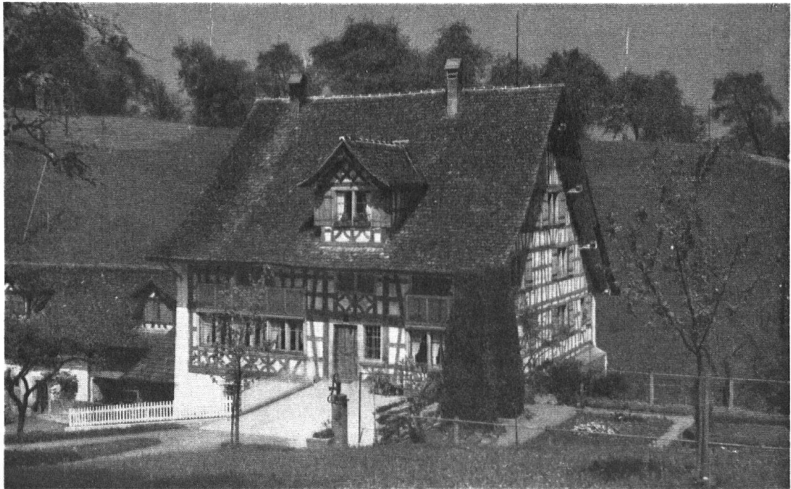
„Mühle“ auf Mühle-stalden bei Schönenberg, Wädenswil.

Souvent il n'a que le mur tourné vers le soleil qui soit construit en pans de bois, peints en rouge; les autres murs sont massifs et montrent très peu de fenêtres.