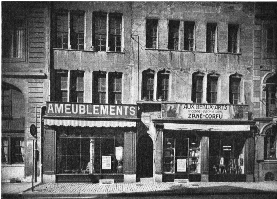
Dans ce cas l'enseigne plate devrait être remplacée par la potence. — Hier gehörte der Aushängearm hin statt der flachen Tafel.

ments, les balcons en fer forgé, elle rompt les lignes et les proportions des maisons par ses lettres gigantesques, par ses prétentions démesurées.