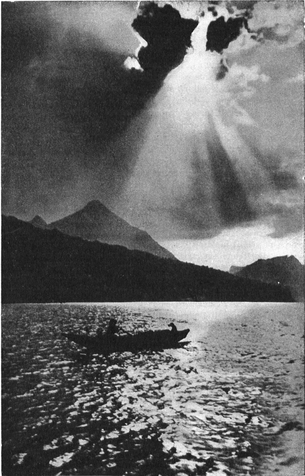
Vorsommerabend am Thunersee. — Lac de Thoune. Un coucher de soleil à la mi-juin.