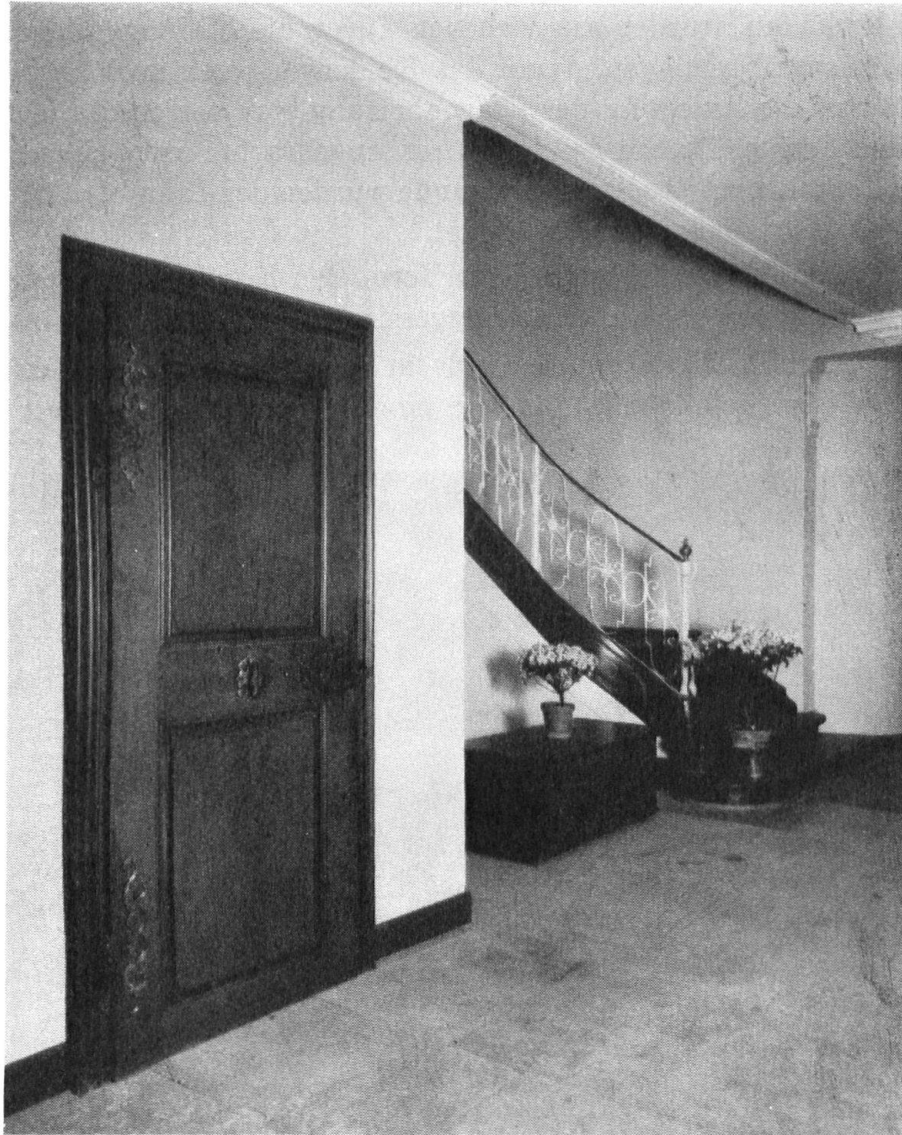
Cage de l'escalier du « Petit Ulm ». La porte provient d'une riche maison bourgeoise démolie.

Treppenhaus im „Kleinen Ulm“. Die Türe stammt aus einem abgebrochenen reichen Bürgerhaus.