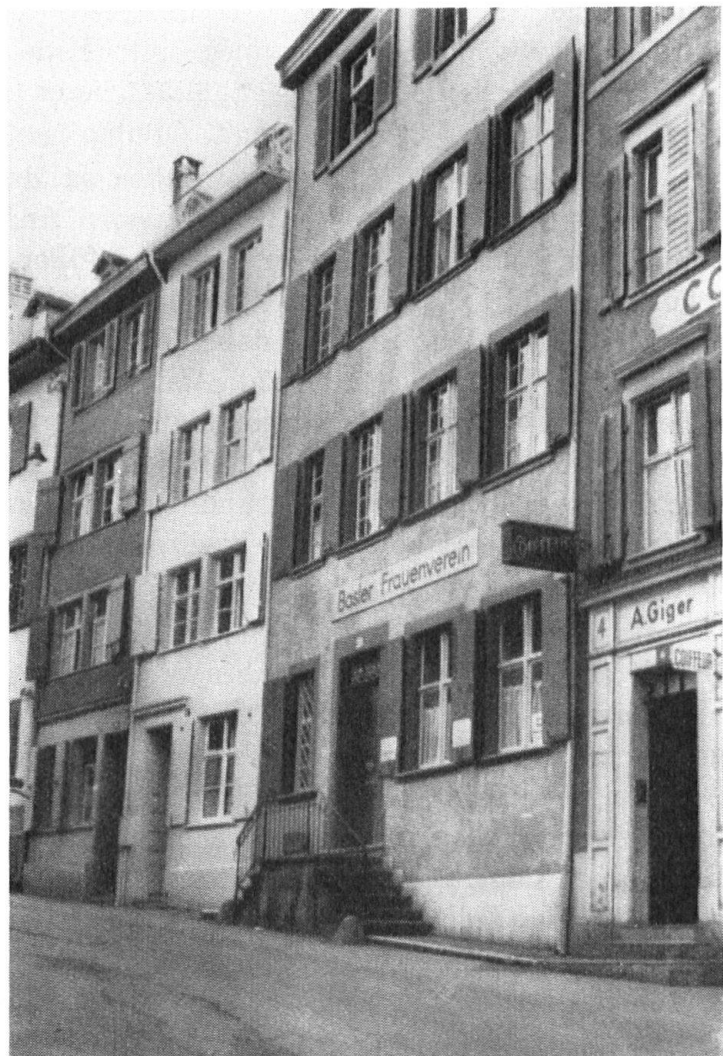
Maison du Heuberg que l'aménagement d'une arrière-cour éclaire désormais de part en part.