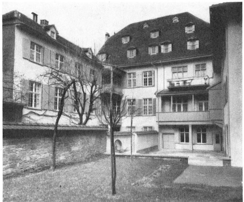
Le « Mittlere Ulm » et le « Kleine Ulm », sous leur toit commun, et leurs ailes côté jardin.