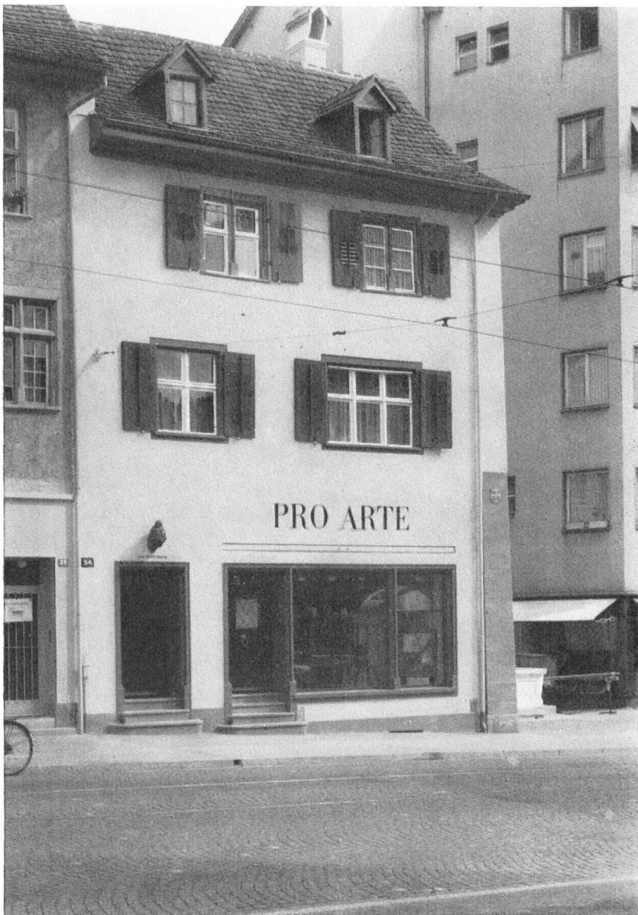
Das Kunsthaus Pro Arte, durch einen modernen Kasten und ein schlecht instand gesetztes gotisches Haus beeinträchtigt.

Damit überhaupt jemand im Hause sei, wurde das Erdgeschoss an eine Bouillonwürfelfabrik, dann an eine Schuhmacherwerkstatt vermietet. Was nicht