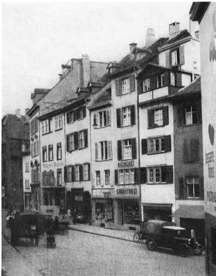
Umgebautes Haus am Spalenberg mit interessanten Dachausbauten.

Einen weitem glücklichen Umbau besorgte ebenfalls am Heuberg (Nr. 24) Architekt F. Largiader. Das Haus der Herren zum Mörsberg stand schon um 1366, wurde dann 1671 neu gebaut und in diesem Zustand durch einen Umbau um 1800 wenig verändert. Das Haus hat sehr schöne, trefflich durchsonnte Räume mit herrlicher Aussicht über das Dächermeer der Stadt; die Erneuerung beseitigte die Aussenaborte, legte ein prächtiges Gitterfenster frei, fügte wieder gute alte Kachelöfen in den Bau, wo sie fehlten, und sorgte für Erneuerung der alten Wandmalereien durch Künstlerhand. Es war eine Freude, zu sehen, wie der Besitzer sein Herz an dieses wirklich rassige Haus gehängt hat.