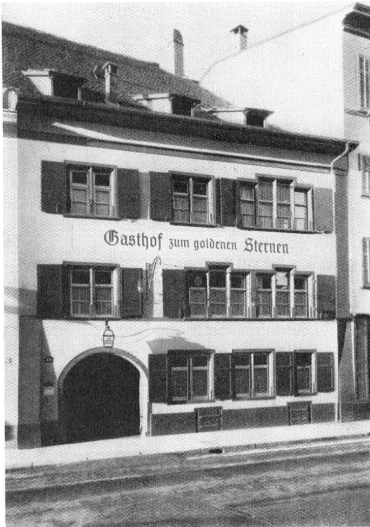
Der gut erhaltene Gasthof „Zum goldenen Sternen“ in der Aeschenvorstadt.

Für etwas anderes als solche Wohnungen eignet sich ein derartiges Haus überhaupt nicht. Es war deshalb auch immer günstig zu vermieten und konnte im Gegensatz zu den vorgenannten ohne jede Unterstützung durch Arbeitsrappen und Renovationsbüro erneuert werden, namentlich weil auch der geschickte Einbau eines Ladens im Erdgeschoss an dieser guten Lage viel zum guten Ertrag der Liegenschaft beitrug.