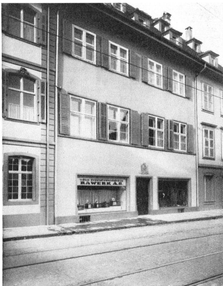
Haus „Zum Mittleren Ulm“ in der St. Johanns-Vorstadt. Es war von Abbruch bedroht und ist nun wieder aufs beste eingerichtet.

Statt nun die Liegenschaft in der Hauptsache zu belassen, und nur im Vorderhaus die notwendigsten, technischen Einrichtungen, welche die Umgestaltung zu einem Mehrfamilienhaus erforderte, vorzunehmen, das weniger wertvolle Stall-