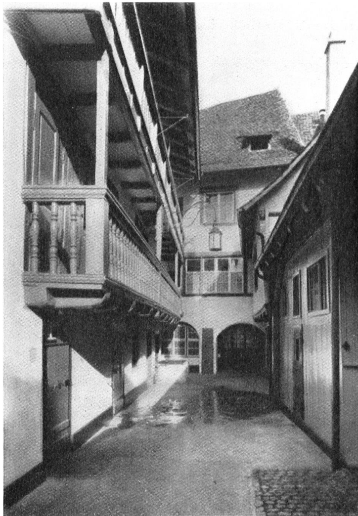
La cour de l'Etoile d'or et ses balustrades du XVIIe siècle.