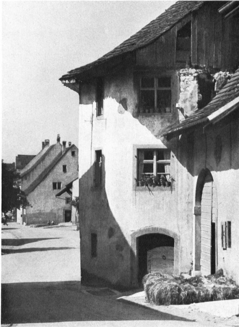
Muttenz. Bäuerliche Häuser an der Gempengasse. Anfang 19. Jahrhundert. Einzeln gesehen sind sie unbedeutend, als Gruppen überaus malerisch.