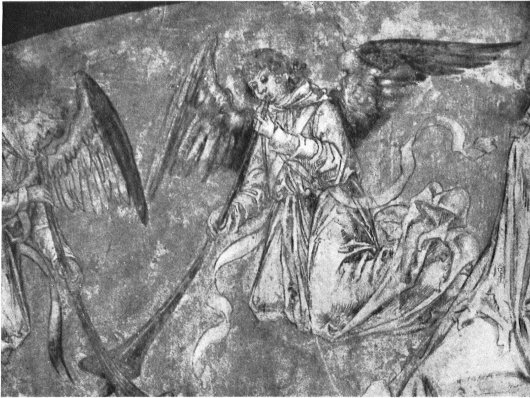
Muttenz. Engel des Jüngsten Gerichtes im Beinhaus. Anges du Jugement dernier (Ossuaire).

was sie waren: Bauern, Handwerker und Krämer. Nur daß sie einen Teil der äußeren Zellen, Äcker und Wiesen als Bauland verkauften. So hat sich das „neue“ städtische Muttenz in angemessener Entfernung vom bäuerlichen entwickelt. Die alten Dorfstraßen und Gassen sind fast unverändert geblieben; an zahlreichen Häusern erfreuen reizvolle Einzelheiten aus der Zeit des Barock, ja selbst der Gotik das Auge des Beschauers. Unter den gemütlichen Giebeln wohnen noch weitgehend bodenständige Familien. Selbst unter den Zuzüglern befinden sich Leute, die zu ihren Wohnungen in Alt-Muttenz Sorge tragen und Verständnis für ihre Reize besitzen. Auch die großen Baumgärten sind fast alle noch unüberbaut.