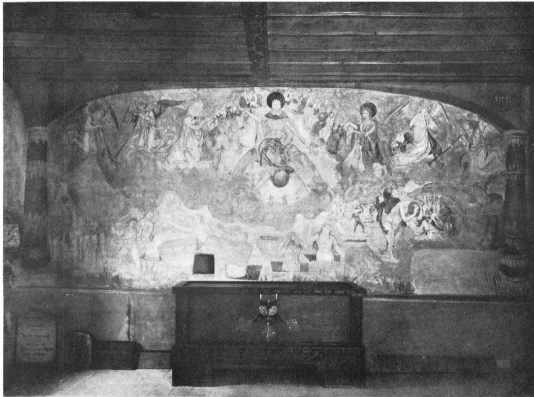
Fresko im Beinhaus der Kirche St. Arbogast zu Muttenz. Ende 15., Anfang 16. Jahrhundert. Ossuaire de l'église de St-Arbogast. Fresque de la fin du XVe siècle — début du XVIe.

ländlichen Bauweise noch nicht entdeckt waren, als es noch keinen Heimatschutz und keine gestaltende Ortsplanung gab.