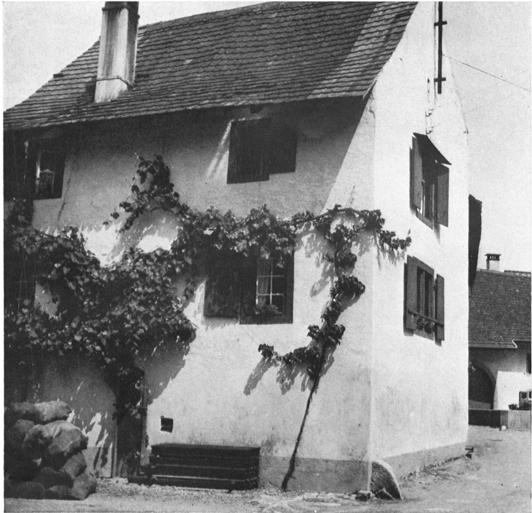
Muttenz, Burggasse 7. Rebenbegränztes Bauernhaus, teils aus gotischer Zeit. La maison à la treille (époque gothique).

amertume. Il nous est bien agréable de présenter aujourd'hui en contre-partie la commune bâloise de Muttenz qui peut être citée, en toutes lettres, à l'ordre de l'armée du Heimatschutz . Les illustrations parleront pour elle.