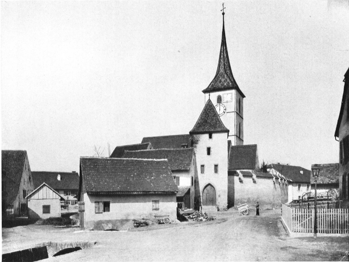
Muttenz. Die befestigte romanisch-gotische Kirche St. Arbogast. L'église fortifiée de St-Arbogast.