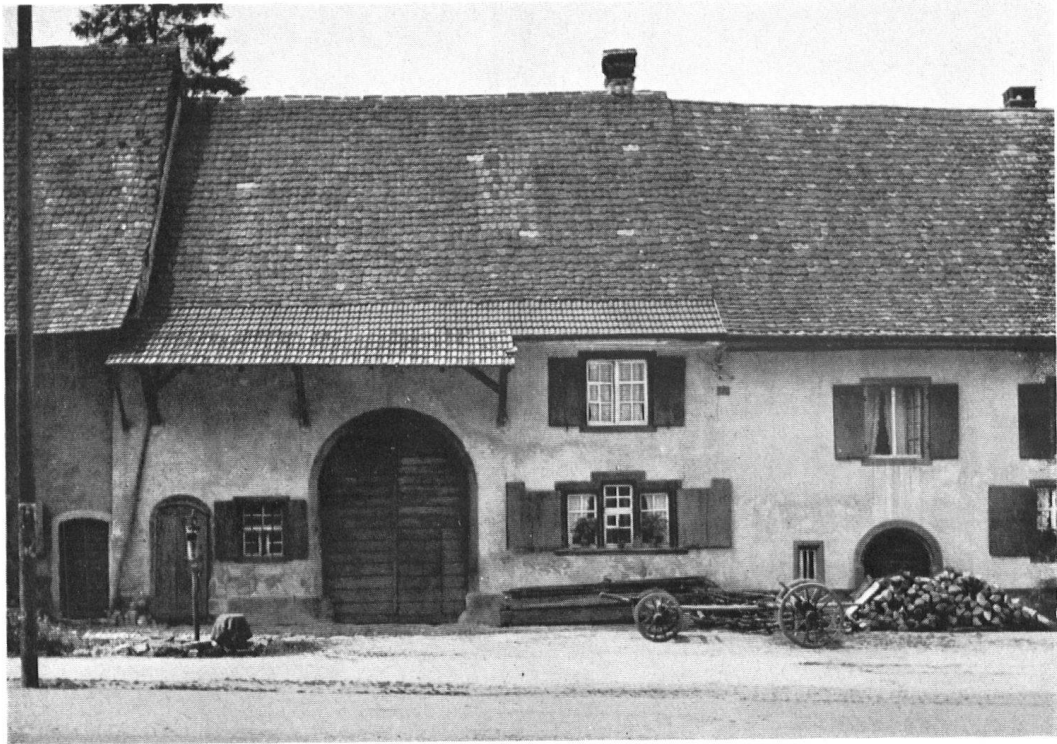
Muttenz. Gotisches Bauernhaus im Oberdorf, Scheunentor mit der Jahrzahl 1684. Besonders schön die Rundbogen der Türen und Tore und das dreiteilige Fenster im Erdgeschoß. In den Obergeschossen Fenster aus späterer Zeit.

Demeure paysanne. Portail de grange (1684). A remarquer les cintres des portes et les fenêtres jumelées du rez-de-chaussée. Les ouvertures de l'étage sont plus récentes.