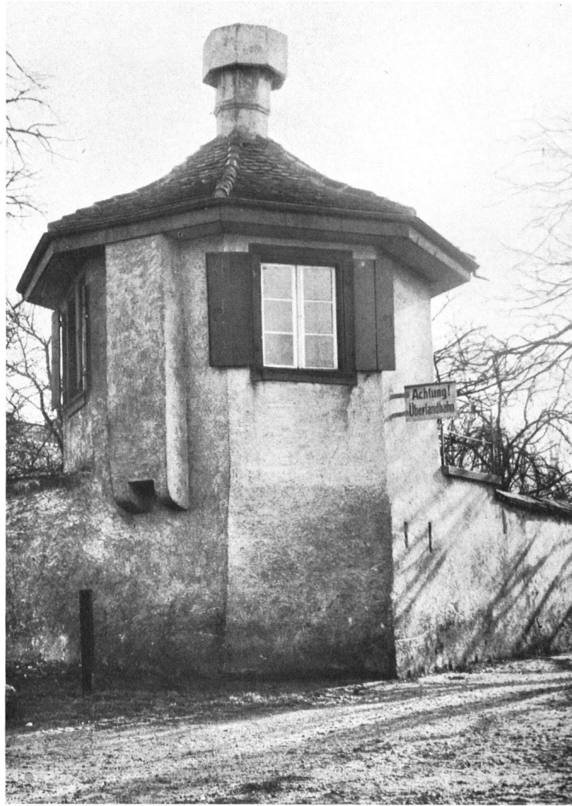
Muttenz. Gartentürmchen beim „Hof“.