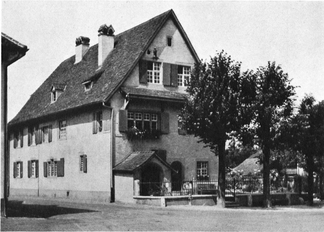
Muttenz. Spätgotisches Pfarrhaus aus dem Jahre 1534. Im Innern eine Eckstube mit gotischem Getäfer und Decke.

Cure datant de 1534. A l'intérieur, chambre d'angle avec plafond et boiserie gothique.