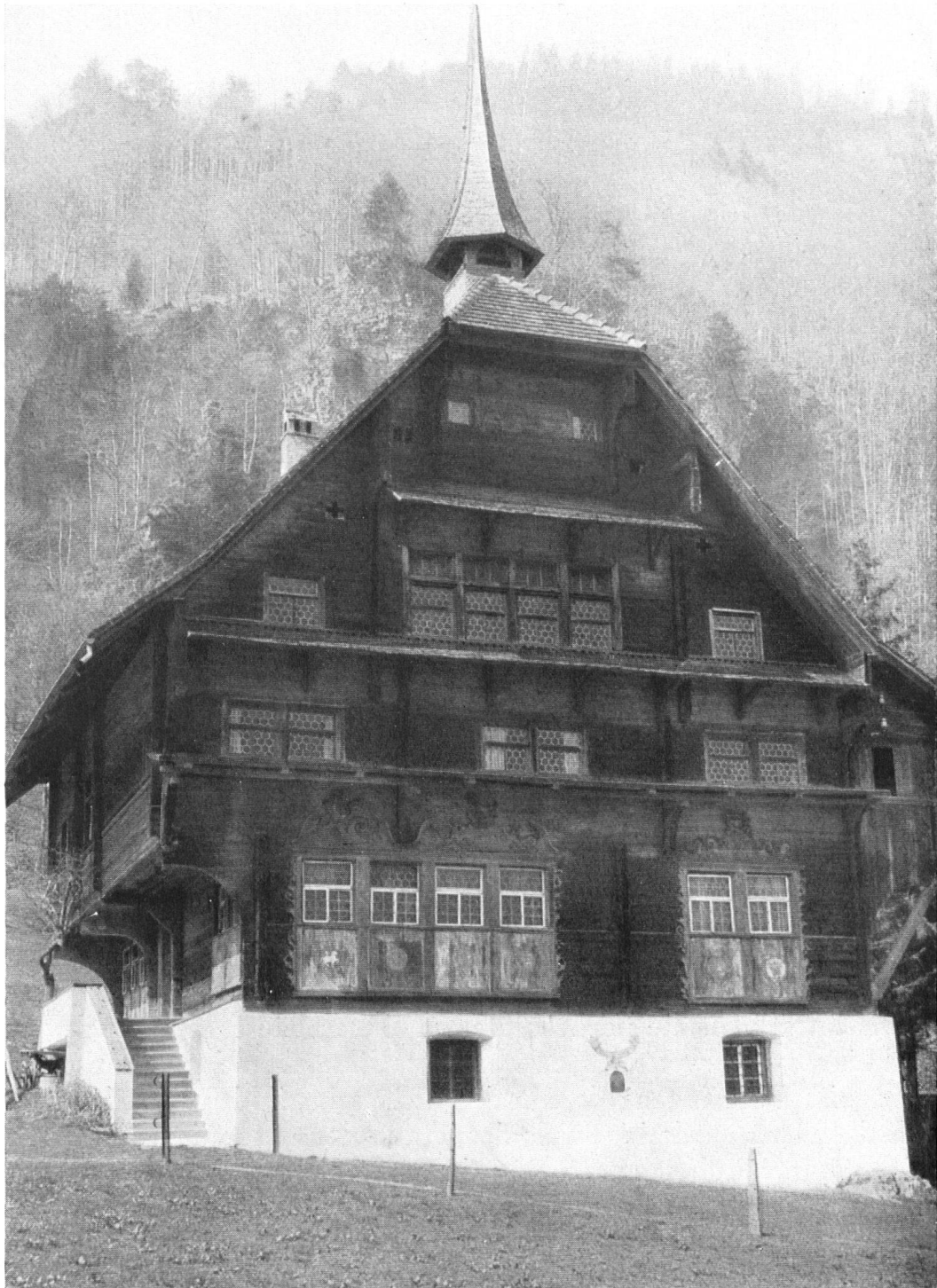
„Höchhuus“ in Wolfenschießen, herrschaftliches Holzhaus erbaut 1586 vom Nidwaldner Staatsmann Melchior Lussy.

La « Maison pointue » de Wolfenschiessen fut édifée pour le fameux homme d'Etat nidwaldien, Melchior Lussy (1529 à 1606).